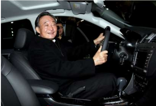
2010年1月30日，吴邦国同志在上海汽车集团股份有限公司技术中心察看新能源样车。