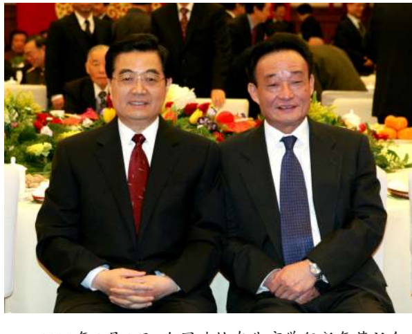
2005年1月1日，全国政协在北京举行新年茶话会。这是胡锦涛同志与吴邦国同志在一起。