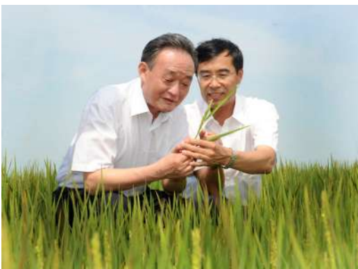
2012年7月19日，吴邦国同志在黑龙江农垦建三江管理局二道河农场万亩大地号察看水稻长势。