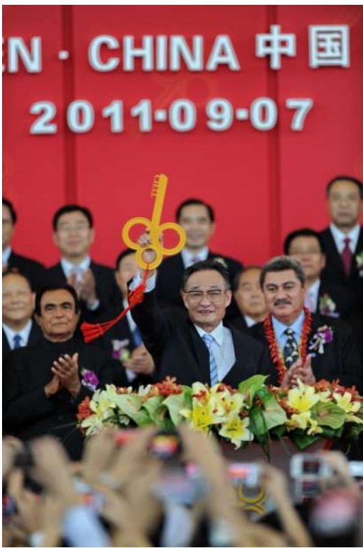
2011年9月7日，吴邦国同志在福建厦门出席第十五届中国国际投资贸易洽谈会开幕式。