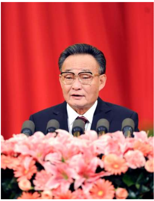
2011年3月10日，十一届全国人大四次会议在北京人民大会堂举行第二次全体会议。吴邦国同志作全国人大常委会工作报告。