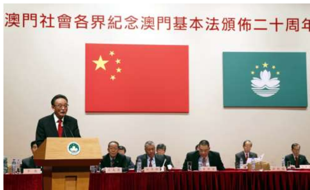
2013年2月21日，吴邦国同志在澳门文化中心出席澳门社会各界纪念澳门基本法颁布20周年启动大会并发表讲话。