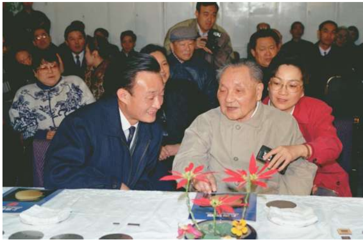
1992年2月10日，邓小平同志在上海贝岭微电子制造有限公司参观时与吴邦国同志交谈。