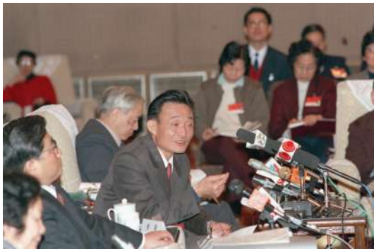
1994年3月，时任上海市委书记的吴邦国同志在全国两会上海代表团全团会议上。