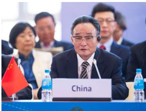
2013年1月28日，吴邦国同志在俄罗斯符拉迪沃斯托克出席亚太议会论坛第21届年会，并作为题为《坚持和平发展 促进合作共赢》的主旨发言。