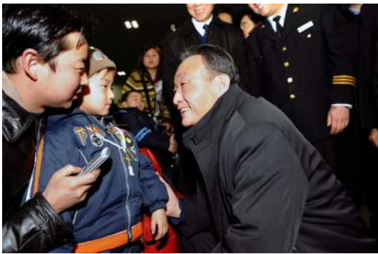
2008年2月3日，吴邦国同志在北京西站候车室与旅客交谈。