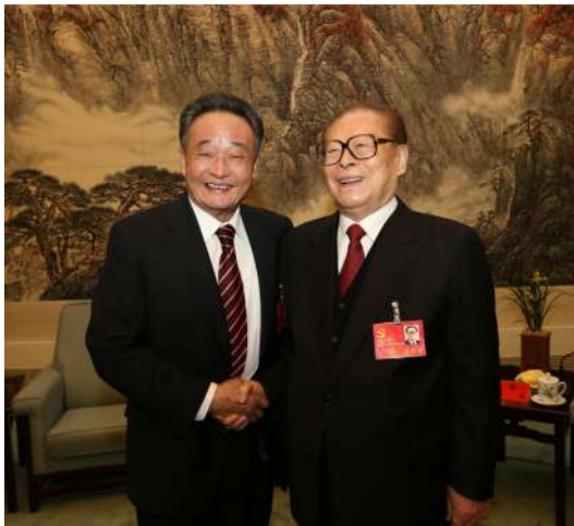
2012年11月14日，中国共产党第十八次全国代表大会在北京闭幕。这是闭幕会前，江泽民同志与吴邦国同志在一起。