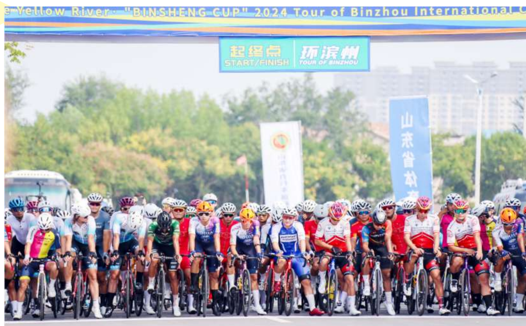
选手在起点蓄势待发。