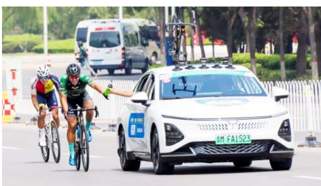
比赛过程中,选手接受赛道补给。