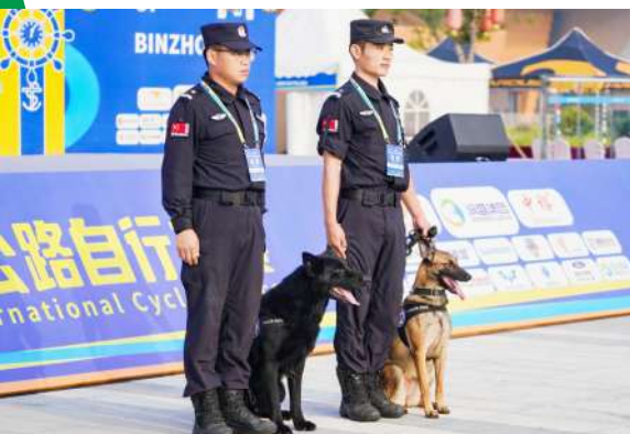
滨州公安全方位保障赛事安全顺利进行。