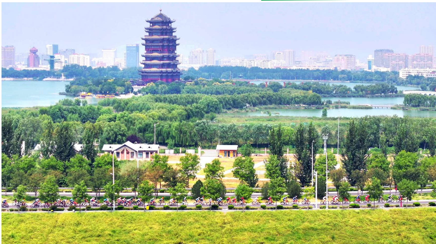
赛道环境好,路面平坦,风景秀丽,运动员们感受一次愉悦的滨州之行。