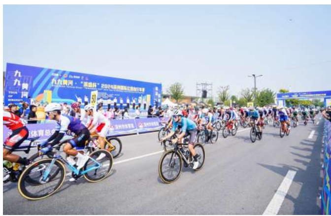
选手们冲出起点、奔向赛道。