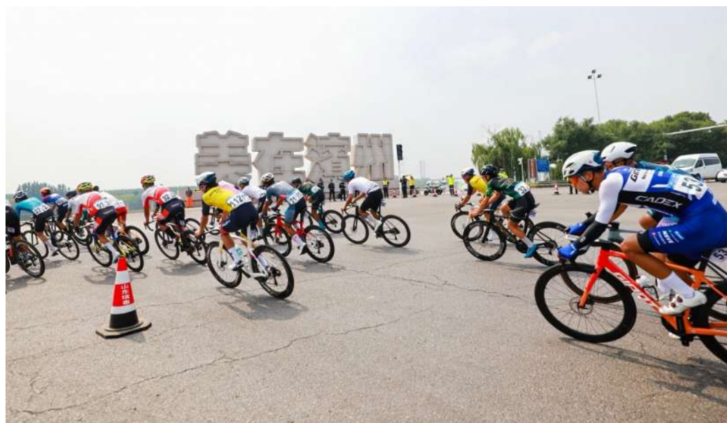
在黄河之滨上演激烈角逐。