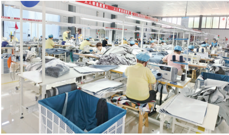
在纺织微工厂车间,工人们加紧赶制订单。

滨州日报/滨州网滨州讯(通讯员 李伟 报道)“以前农闲的时候,在家愁找不到零活,家里有老人孩子,外出务工又不方便,在附近很难找到合适的工作。现在在共富微工厂开到了家门口,这些纺织、电子元件组装工作简单易学好上手,既不耽误接送孩子,又能照顾到老人,每天还能有一笔收入,日子越过越有奔头了。”阳信县劳店镇湖畔家园村村民解女士开心地说。