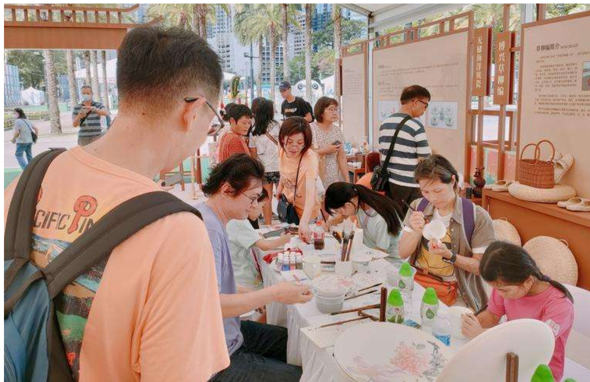
在香港维多利亚公园举办的大型展览活动现场,香港市民积极对山东海瓷集团的贝壳瓷技术大加赞扬,并积极参与手绘活动。

在山东海瓷集团1000平方米的海玉馆里,布满大厅的文化两创产品格外耀眼,这里不仅可以看到琳琅满目的海瓷产品,还可以看到大师们丰富多彩的手绘产品。在这里,你可以充分发挥自己的想象,描绘出自己心中的诗和远方。在郭春森看来,非遗要创造性发展,创新性