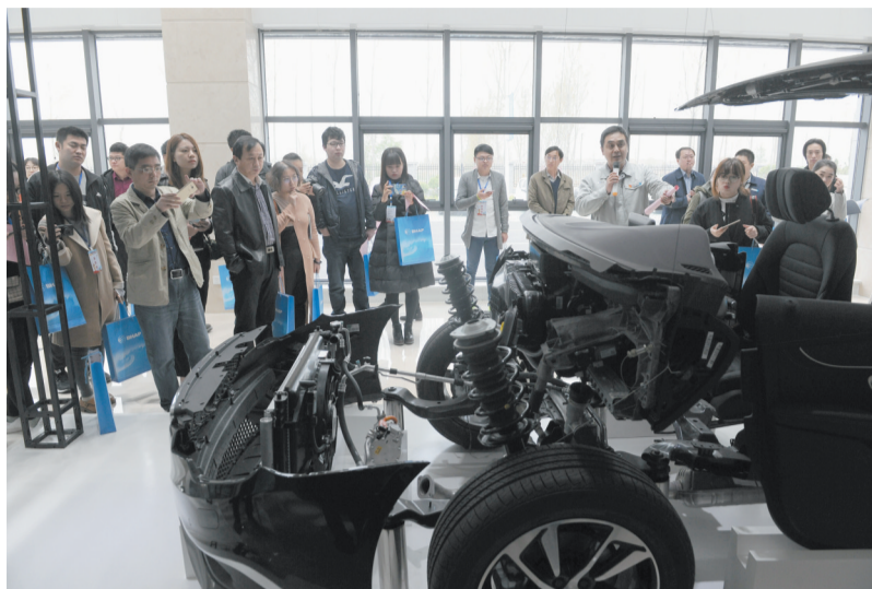
记者们在海纳川(滨州)轻量化汽车部件有限公司参观采访。

造为基础,以“中国制造2025”纲领为标杆,全面对标安全节能、绿色环保、先进制造系统和可追溯质量管控等多项符合现代高端制造业要求的行业标准,追求品质和效率的持续提升,建设一个现代化、数字化、自动化、智能化的国内一流汽车铝合金零部件生产制造基地。工厂重点岗位全部采用机器人替代人工操作,全面实现智能化车间管理,铸造和机加工过程采用一维码、二维码对零件进行标识及应用视觉识别系统,实现产品质量全生命周期可追溯。生产线设备引进具有国际先进水平的生产设备及仪器,以性能价格比高、先进适用且运行稳定可靠为原则,完全满足适应增加新工艺、新