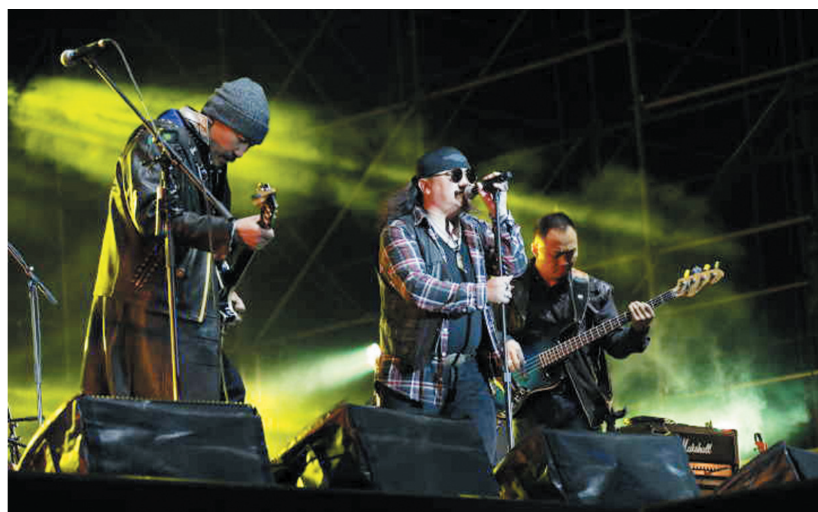
杭盖乐队的演唱，把蒙古音乐的精髓和摇滚乐的力量传递给了观众。