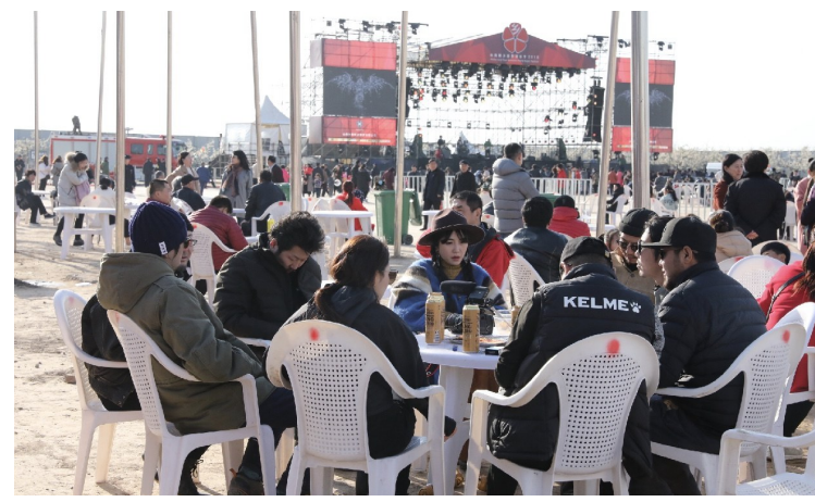
赏梨花、品美食、听音乐，音乐节期间来自各地的乐手、观众在一起享受假日时光。