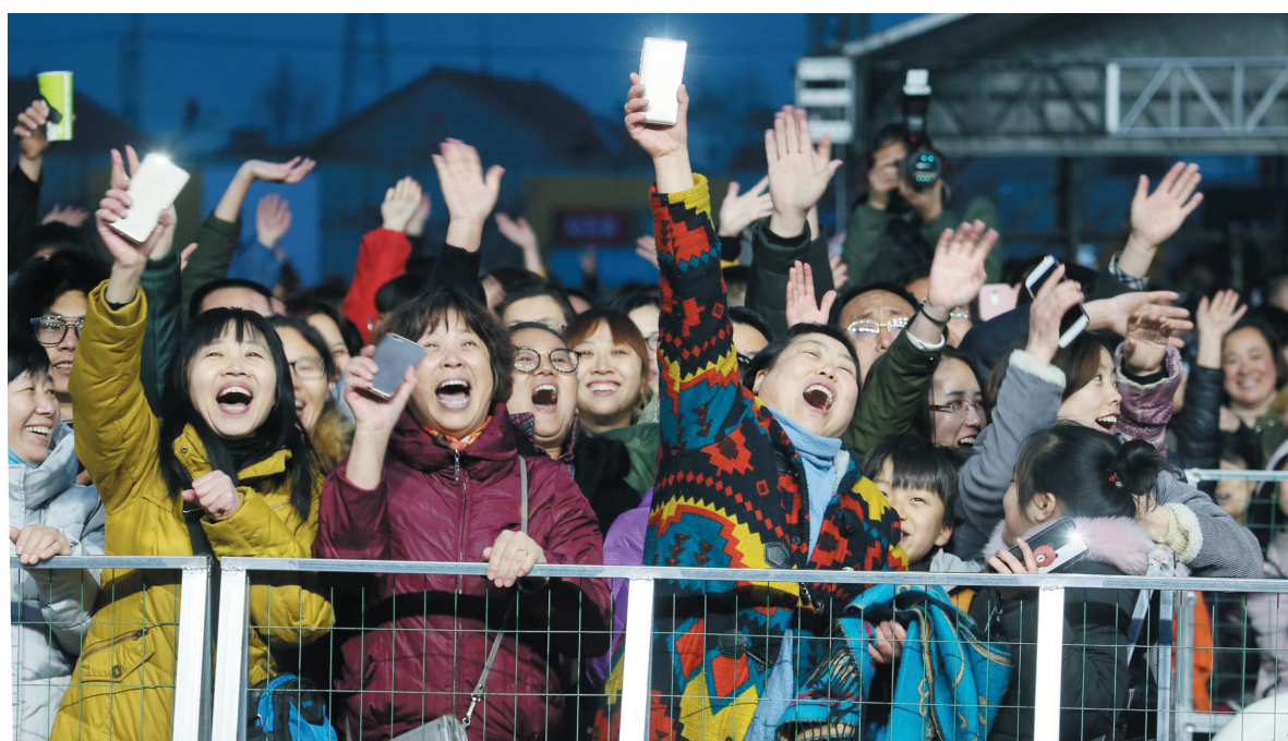
激情的音乐，让梨乡群众沸腾起来。

据了解，与去年首届音乐节的13支乐队相比，本届音乐节的规模和档次更上一层，共有来自9个国家和地区的26组音乐团体登台献唱，并增设了“清和”、“正阳”两个舞台，还特设美食节板块与烟火表演。不同民族血脉里的音乐在万亩梨园汇聚、碰撞，这是一场音乐的狂欢，也是一场跨越时空和距离的聚会。