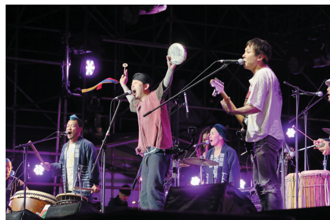
龟岛乐队的演唱融合了日本庆典音乐与传统民间音乐元素。