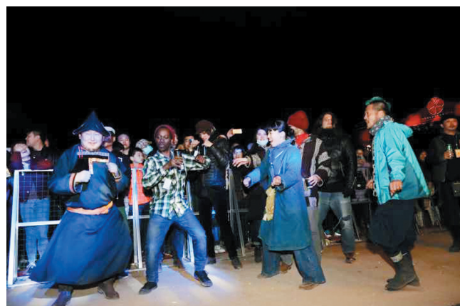
被音乐感染的观众，与台上一同互动。