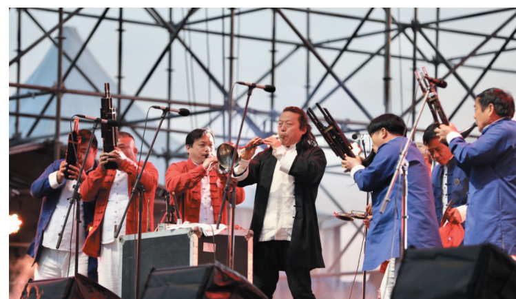
曾经吹响了欧洲各大音乐节的“周家班”，带着中原汉族音乐走上梨乡舞台。