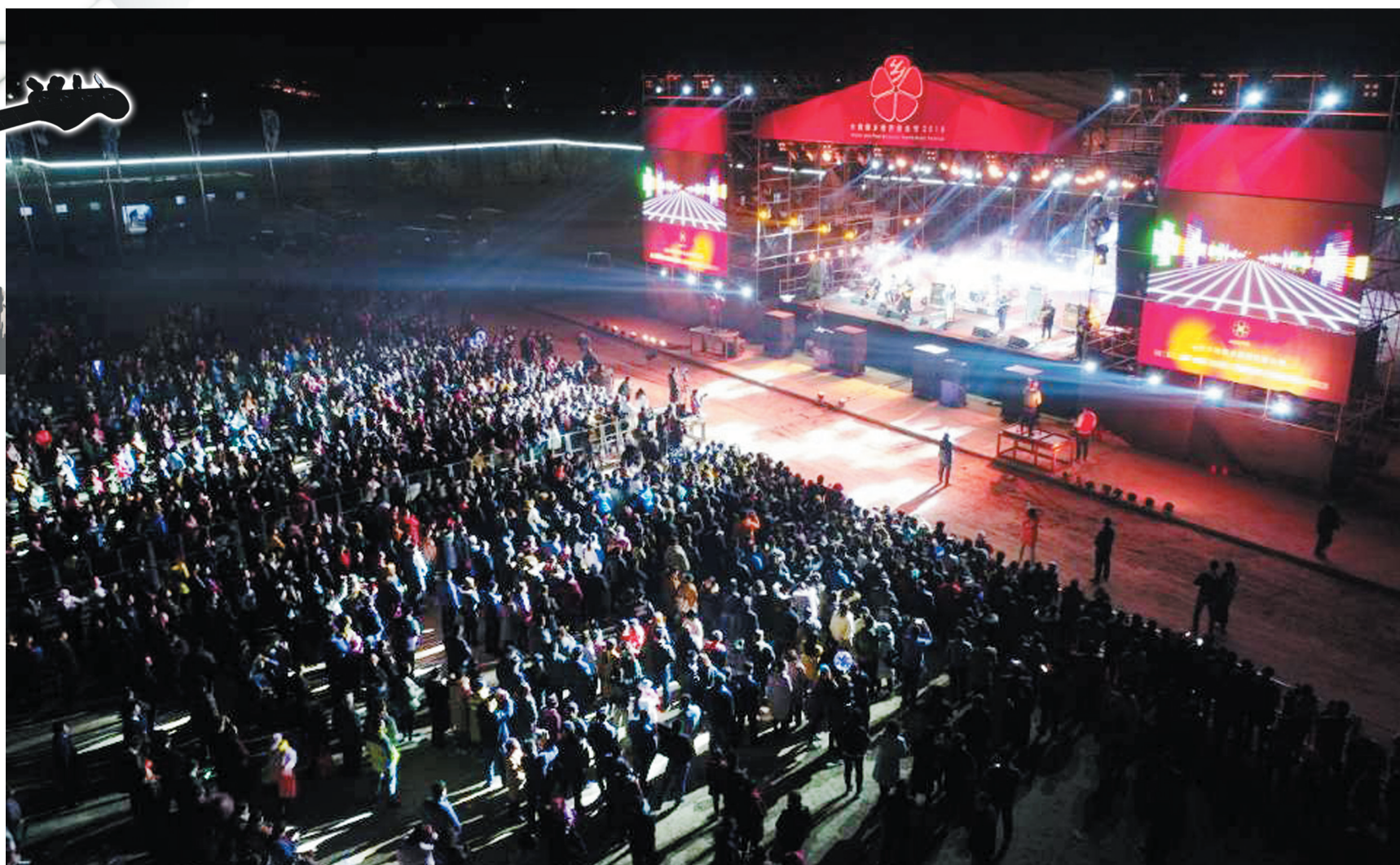
三天的“世界音乐节”，嗨爆了梨乡，吸引了国内外观众。

人间芳菲四月天，阳信万亩梨花白。又是一年梨花盛开的季节，4月7日晚，伴着最后一支乐队OKI高昂的歌声和绚烂的烟花，为期三天的第二届阳信水韵梨乡世界音乐节在观众热情的欢呼声中完美落幕。