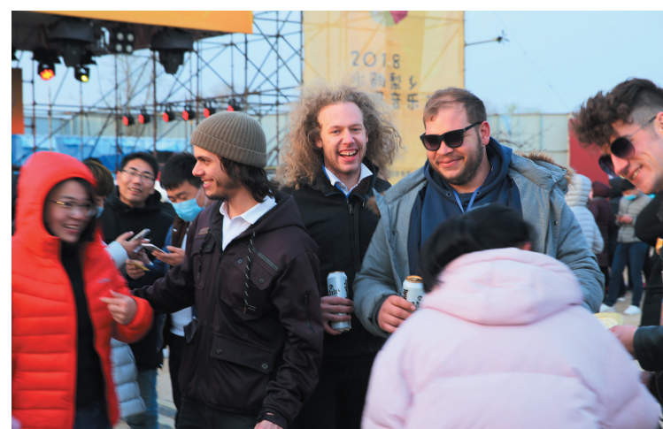
来自世界各地的乐队走进梨乡，把异国音韵带给阳信。