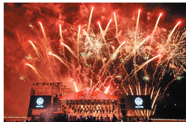
绚丽烟花随着激情音乐，热烈绽放。