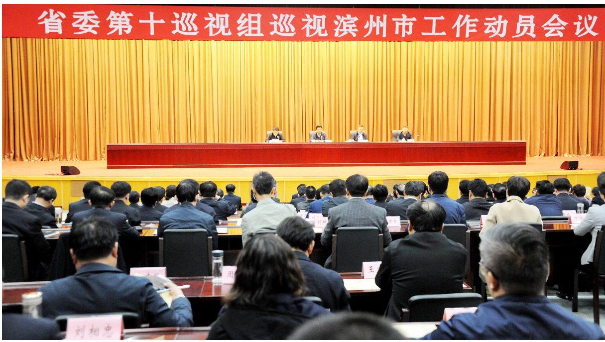
4月4日上午,省委第十巡视组巡视滨州市工作动员会召开。