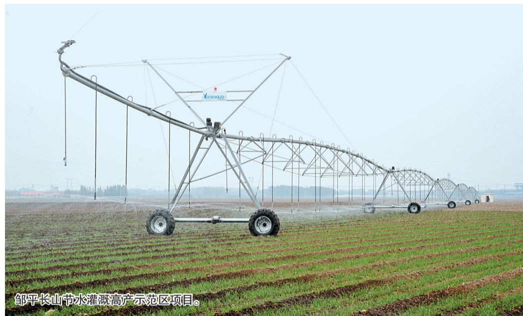
邹平长山节水灌溉高产示范区项目。

围绕构建“八大”水利基础网络，今年全市水利工作分解了23项重点水利工作任务。主要是投资1.7亿元实施好中海水资源综合利用、南环河西段治理、北环河贯通等城区水系生