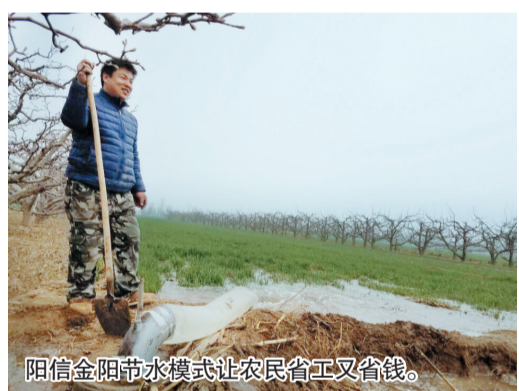
阳信金阳节水模式让农民省工又省钱。