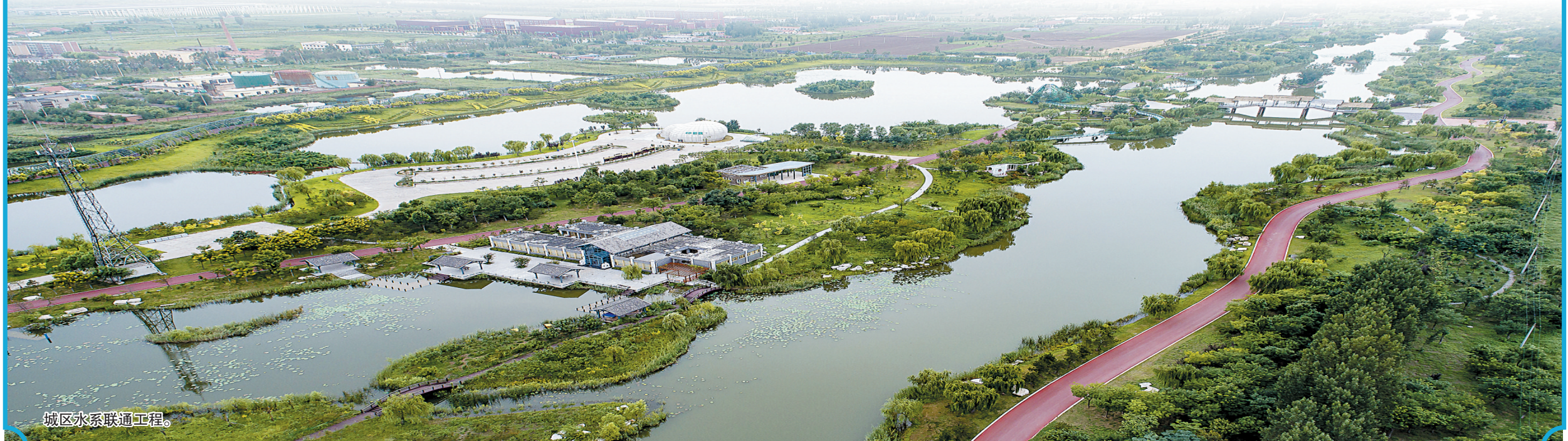
城区水系联通工程。