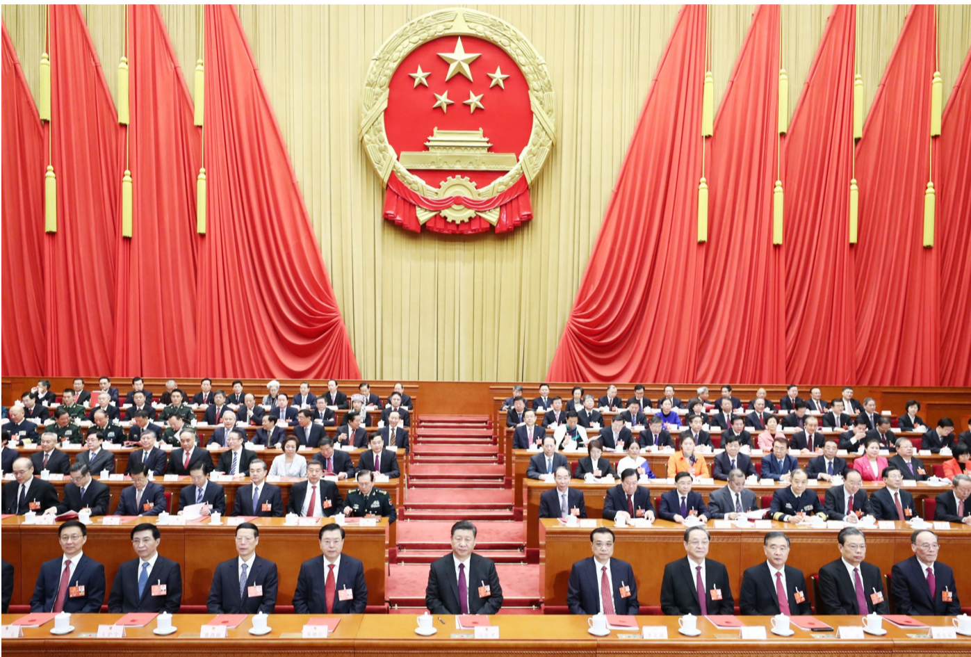
3月20日，第十三届全国人民代表大会第一次会议在北京人民大会堂闭幕。中共中央总书记、国家主席、中央军委主席习近平发表重要讲话。