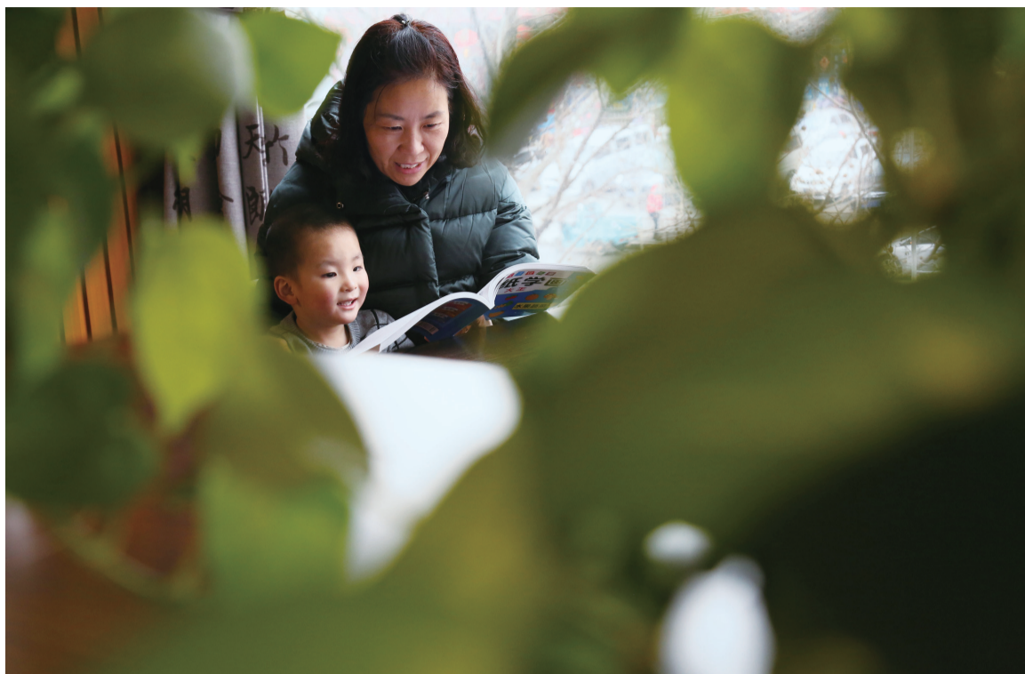
在博兴县新华书店,一对母子共同翻阅图书,体验别样的亲子时光。