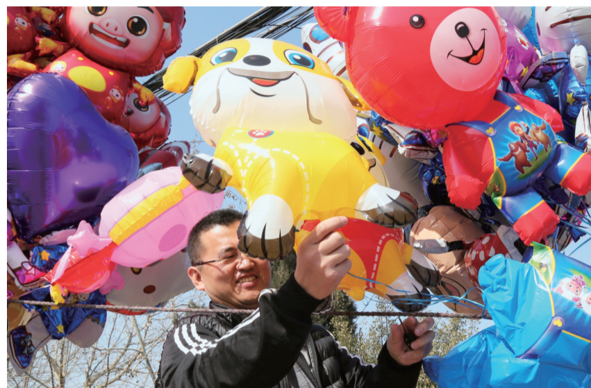
童心不改 方敬杰摄于无棣