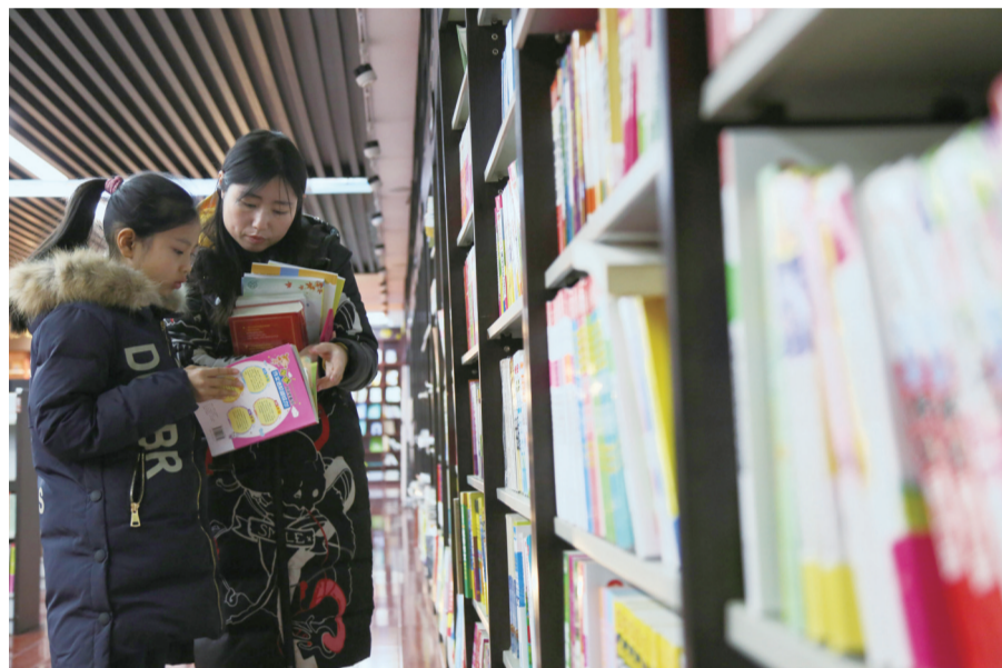
家长带着孩子选购课外读物,为新学期“充电”。