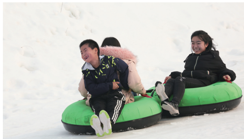
雪地飞驰 陈彬摄于博兴