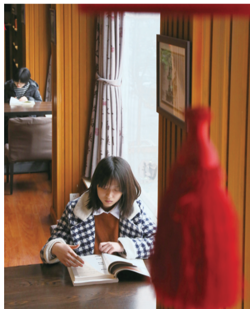
寻一本好书,在书海中畅游,舒心又惬意。