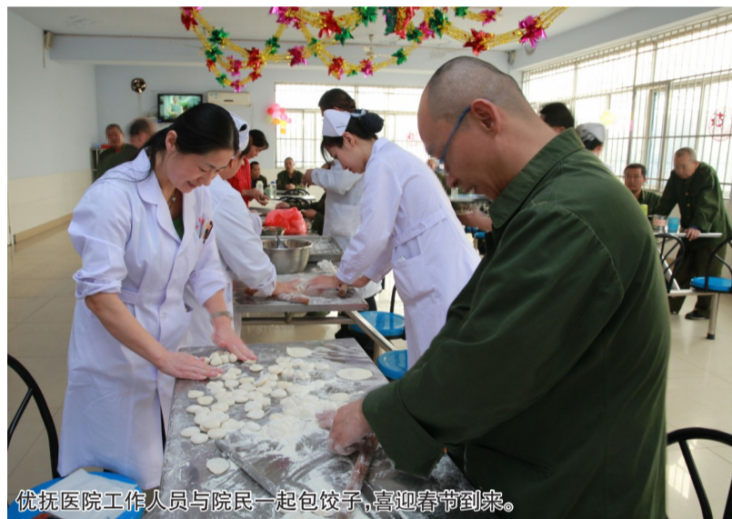
优抚医院工作人员与院民一起包饺子,喜迎春节到来。

在优抚医院接受治疗的多为精神病患者。事实上,不少精神病患者如果治疗及时的话,病情是可以控制的。可惜的是,贫困家庭的精神病患者多因经济条件所限,难以获得有效治疗。为了给这一部分人群以关怀和保障,过去一年,滨州市优抚医院联合市慈善总会开展了“呵护心灵·爱与同行”扶贫救助项目,全年共救助贫困精神病患者99人,累计支出善款135.8万余元,为贫困家庭带来了福音。