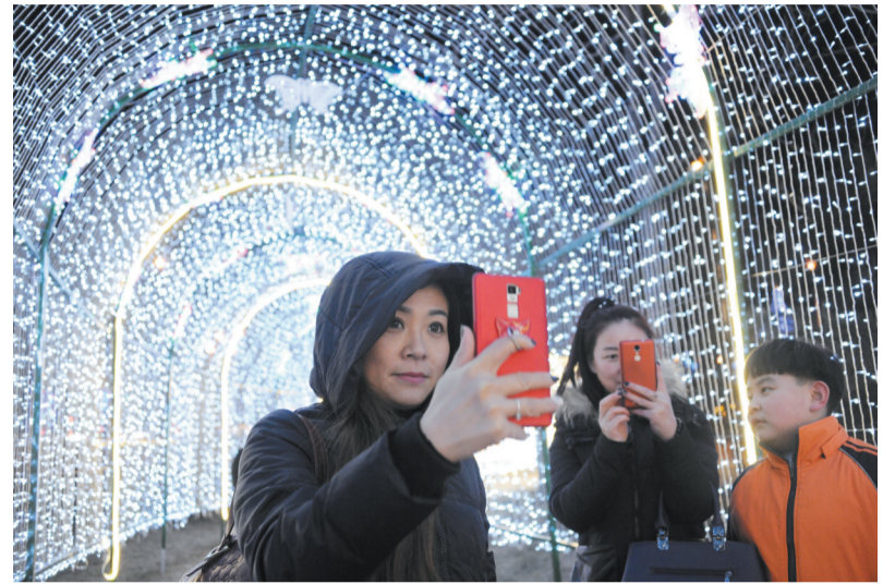
市民在200米长的灯光隧道内拍照留念。