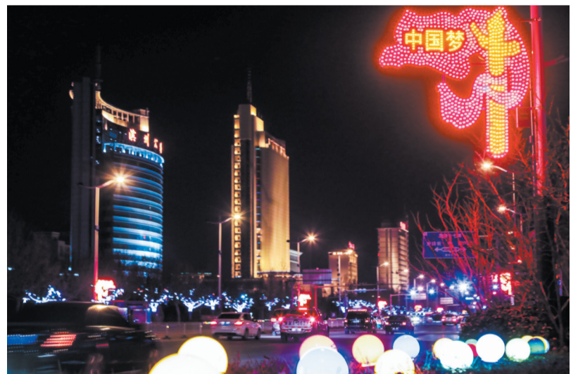
以华表、旗帜为造型的灯饰突出了中国梦的主题。