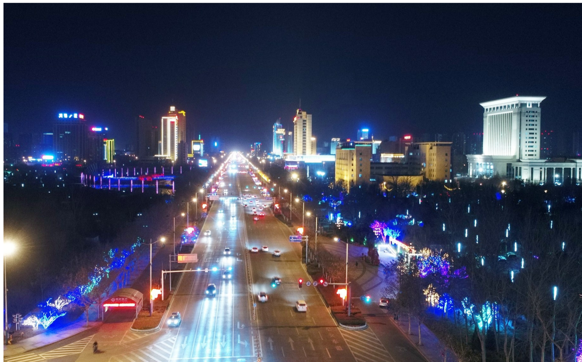
夜色中的滨州城区华灯璀璨,五彩斑斓。