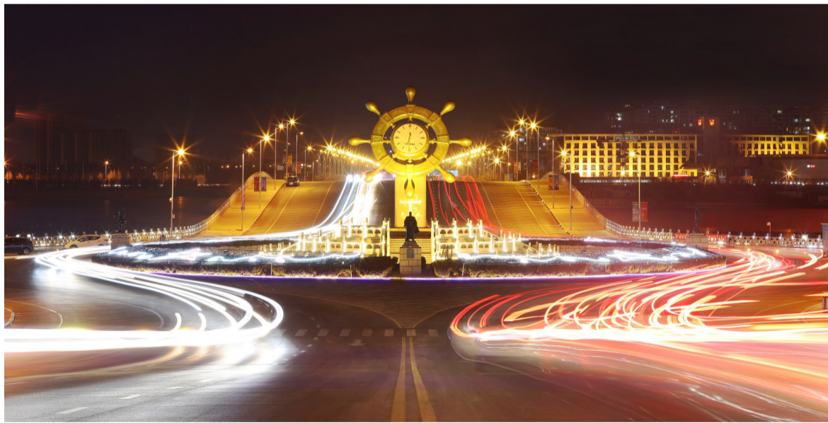
太阳岛上流光溢彩。