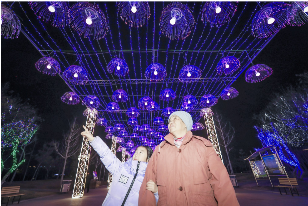
中海公园南门利用“水母”灯呈现出的亮化效果如梦如幻。

夜幕降临,不妨携家人、朋友一起漫步城区街头,看夜景、品灯饰,沉醉在这灯光塑造出的多彩梦幻世界里。