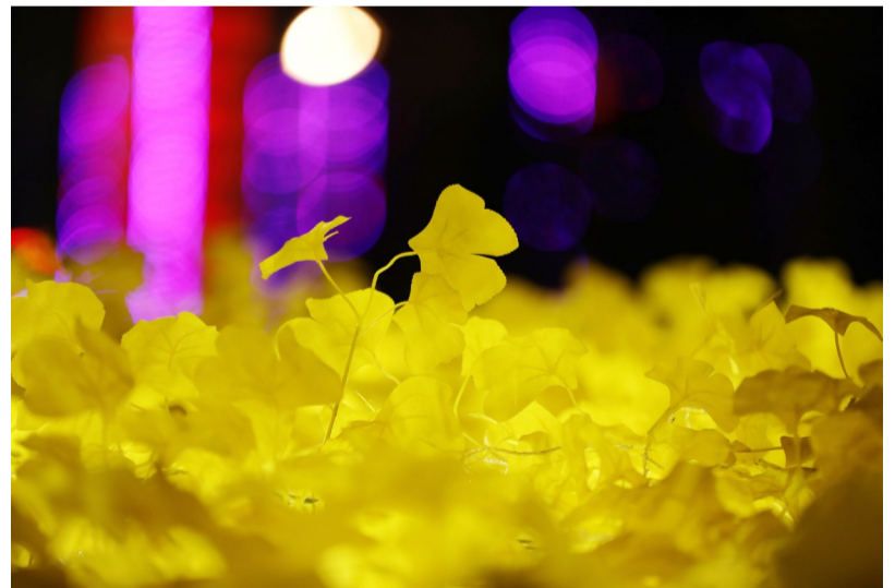
渤海十八路上的鲜花灯饰带来了春的气息。