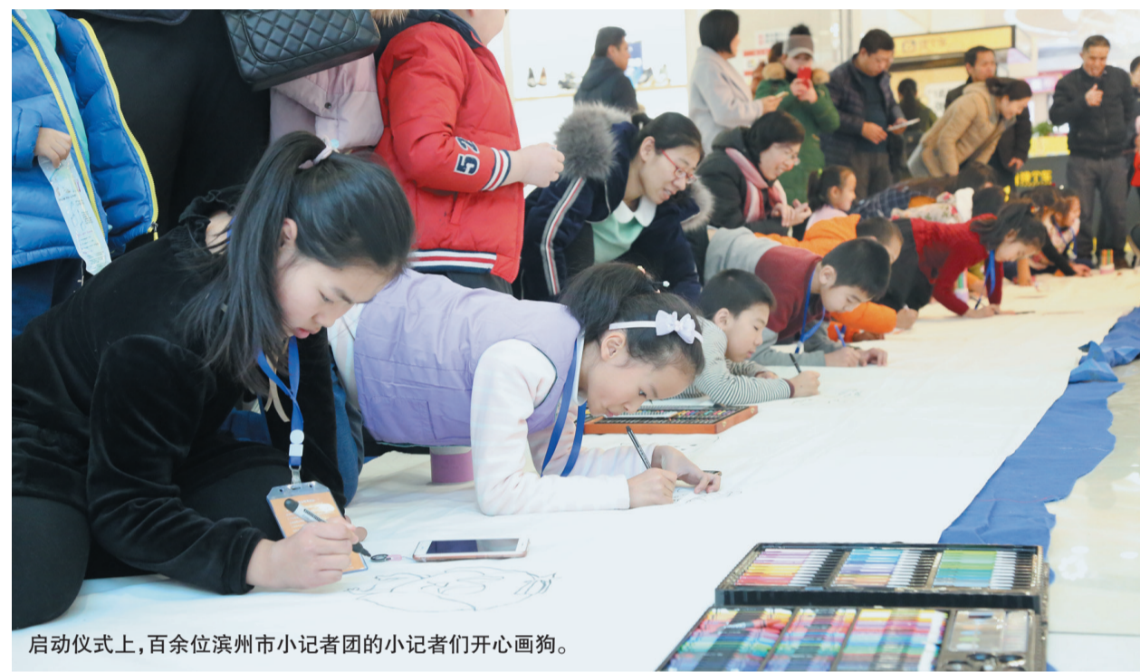
启动仪式上,百余位滨州市小记者团的小记者们开心画狗。

狗主题绘画比赛”活动专题,进入活动网页,点击上传作品进行参赛,点击佳作展示进行投票。每幅参赛作品须标明作品标题(不超过10个字)、作者真实姓名、小记者证号、联系电话等内容。作品须是小作者独立完成,所有参赛作品一律以电子文件格式投稿,每位作者每人限投1稿。