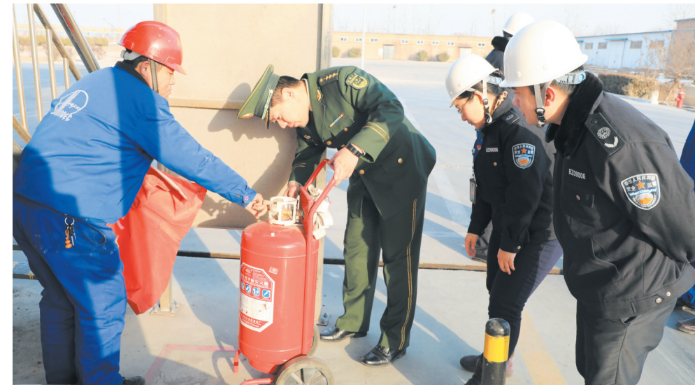
滨州高新区消防大队工作人员在检查小营油库灭火器械