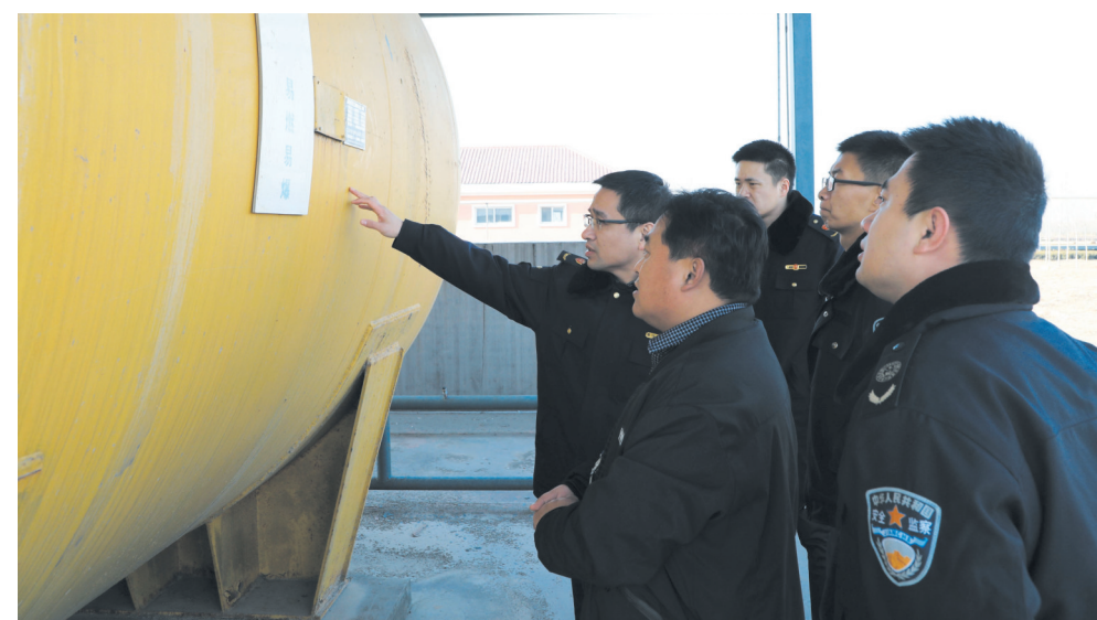
滨州高新区安监、质检部门工作人员在企业检查液氨存储设备