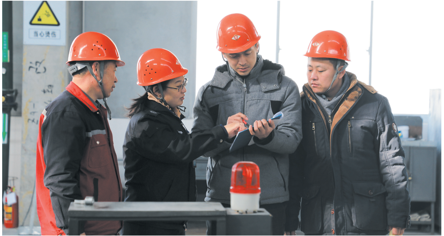
滨州高新区安监办邀请安全专家为企业查隐患

狠抓“双体系”建设,持续推进风险管控和隐患排查治理。研究制订高新区“两个体系”建设推进方案,成立专门领导小组,筛选确定辖区内5家安全管理相对较好的企业作为市标杆企业,并全部完成标杆企业自评工作。高新区坚持“选标、立标、追标”工作思路,以“风险辨识要全面,风险共识到全员,风险标识在眼前”的工作思路,督促标杆企业改进完善“两个体系”建设。期间共指导帮扶5家市、区级标杆企业设置“两个体系”建设公告栏12处、风险点标识牌216块,分批次组织辖区32家生产经营单位56人次参加培训学习,发