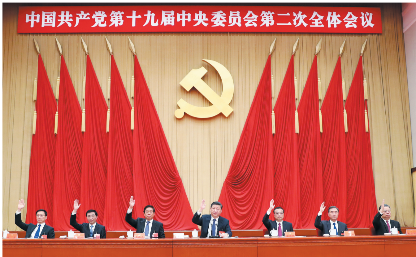
中国共产党第十九届中央委员会第二次全体会议，于2018年1月18日至19日在北京举行。中央政治局主持会议。