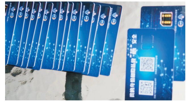
开发区首批300名工作人员全部完成eID卡贴卡工作。