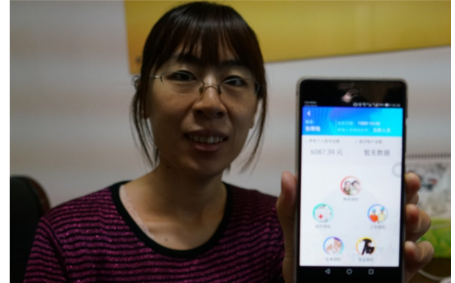
通过贴卡进行网络身份认证后,即可实名登录智慧开发区APP。