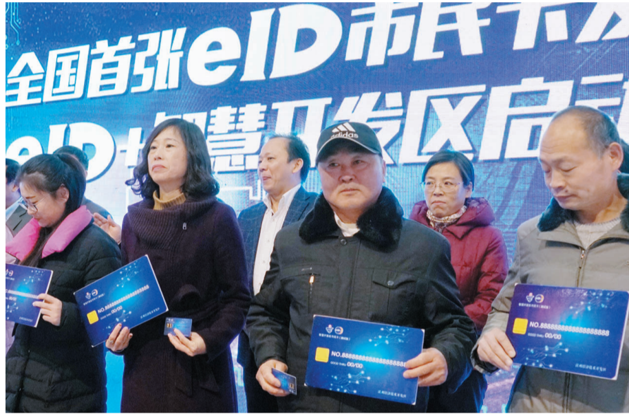
全国首张eID市民卡发放仪式现场。