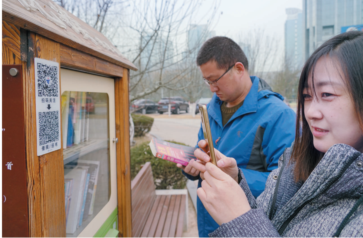
有了eID卡后,市民可以在不透露身份信息的前提下在共享书屋借还书籍。

未来,“eID+智慧开发区”将以“1+1+N”为战略框架,通过对网络行为责任主体的身份确认、信息资源的授权访问、敏感数据的安全保障等,实现政务资源的有效整合和信息资源的安全共享。围绕市民普遍关注的热点难点问题,继续推进“eID+”服务模式,结合2018年区级政务服务中心建设,以市民卡为载体,依托京东云大数据中心硬件基础,打造“eID+政务服务”平台。通过“eID+政务服务”平台,实现远程、现场身份识别和事项办理,简化办事流程,提高工作效率,努力建成“少跑一趟路、少跨一个门槛、少走一道程序”的政务服务体系。