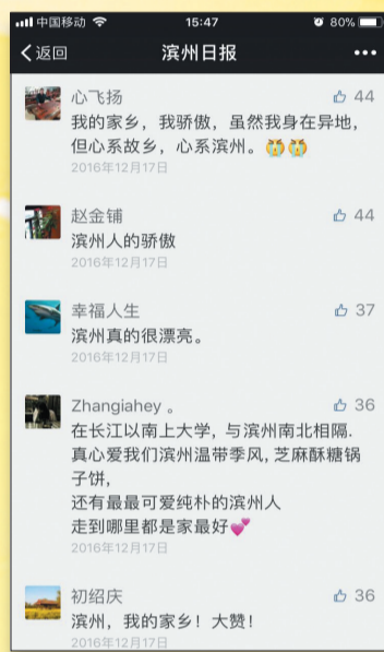
《爱在滨州》MV发布后引发网友激烈讨论