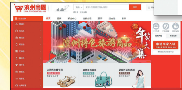
滨州商圈首页截图

如今,滨州网直播再度升级,滨州网可实现与新华社APP、今日头条同步直播。很多重要活动,网友可以分别在滨州网APP的微直播频道、新华社APP的现场云频道和今日头条的直播频道中,同时看到滨州网发布的直播内容。