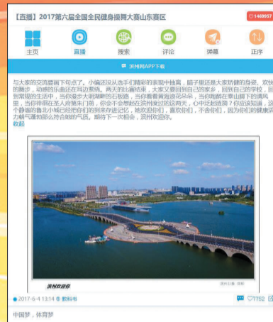
单条直播点击量超过146万

滨州商圈是滨州网旗下的区域性综合购物网站,直接对接原产地,各品牌商家,致力于为广大市民提供放心、实惠的优质产品。滨州商圈采用先进的国内专业B2B2C多用户商城系统,可实现便捷、安全申请店铺入驻和在线交易。滨州商圈专注于滨州本地大中小型商家提供电商服务和宣传,包括总代理、原产地、专营店、精品店四大板块,涉及酒水类、食品类、日用百货类、礼品类、服饰类、特产类等六大行业产品的销售与批发,可满足各类消费者需求,真正实现“一站式购物”的区域综合电商平台。