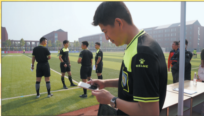
在全国中学生足球锦标赛上,裁判员使用滨州校园足球网赛事管理系统。