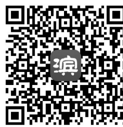
扫描二维码下载滨州网手机客户端

两年时间,滨州网在社会各界的关心支持下正在茁壮成长。立体、多元、全面的传播能力,会更好地传递党委和政府、群众的声音。我们将继续保持奋进的姿态,博采众长,继续拓展功能和服务,真正成为滨州市委、市政府和滨州人喜欢的滨州网。