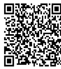
扫描二维码读报告摘要