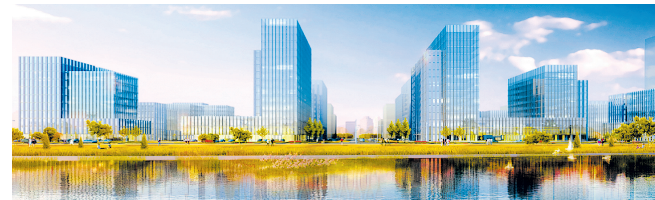
中建智立方项目全力打造集科研、研发、产业服务、总部基地为一体的现代高科技产业孵化中心。