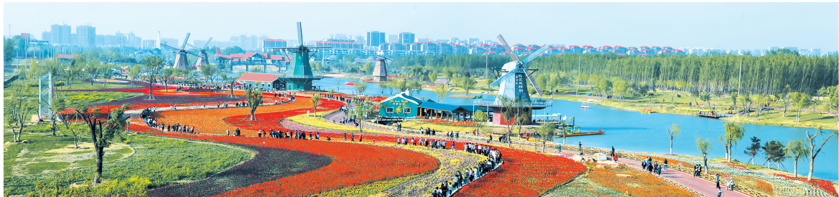
15公里的秦皇河公园,打造出一条优美的生态景观轴线和经济隆起带。