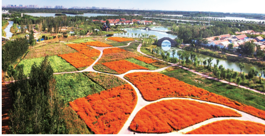
狮子刘村入选首批“中国乡村旅游模范村”、全国文明村,2017中国美丽乡村乡村特色小镇民居村和全市唯一一个“全国环境整治示范村”。

立足创环境、增活力、聚人才,全区院士工作站、博士后工作站等创新载体达24家;拥有“千人计划”专家、博士后等高层次人才170人。泰义金属研发的“金籽奖”;盟威戴卡机器人密度达到125台/千人,世界同行业领先水平。全球难度系数最大的20寸轮毂制成成功,同比增长近6公斤。渤海活塞获得装备重大科技工程(智能机器人)专项支持。 聚焦行业前沿,统筹推进科技人才优势集成。由上海由集团与上海锐嘉科集团联合投资的黄河三角洲科技集团一期工程于2018年春天开工建设。由中建国际投资公司在秦皇河两岸总投资70亿元,建设占地400余亩的智立方项目,总建筑面积50万平方米,打造集科研、研发、产业服务、总部基地为一体的现代高科技产业孵化中心。北汽集团投资1.1亿元建设汽车轻量化研发中心,实现产业链与创新链联动发展,推动产业向高精尖领域延伸。华翔众创和彩虹被评为省级众创空间,入驻创客项目130余家,已有美国海归专家创建的朗锐科技以及乙仁能源、法通科