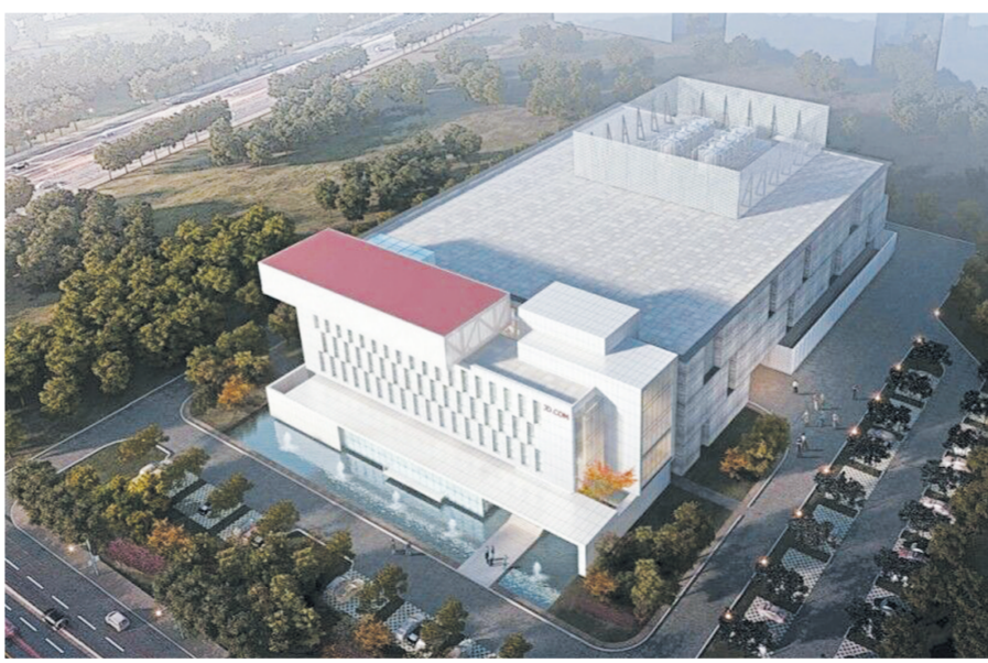
2017年4月28日,京东集团投资15亿元的黄河三角洲大数据中心开工建设。目前,该项目基础工程基本完工,一期工程计划2018年上半年投入使用。