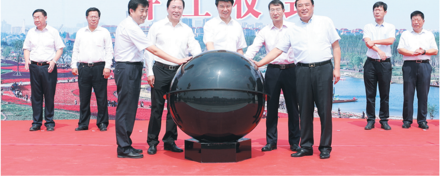
2017年9月1日,市委副书记、市长崔洪刚参加滨州经济技术开发区清洁取暖改造开工仪式。