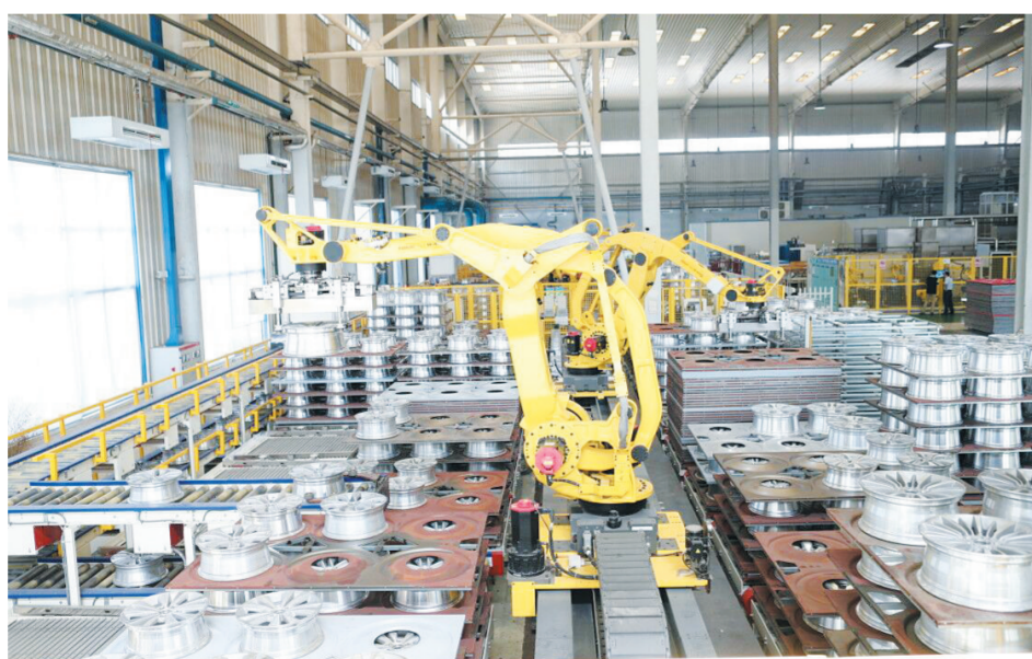
盟威戴卡智能制造升级改造项目,轻量化、智能化水平世界领先。全球难度系数最大的20寸轮毂制成成功,同比增长近6公斤。