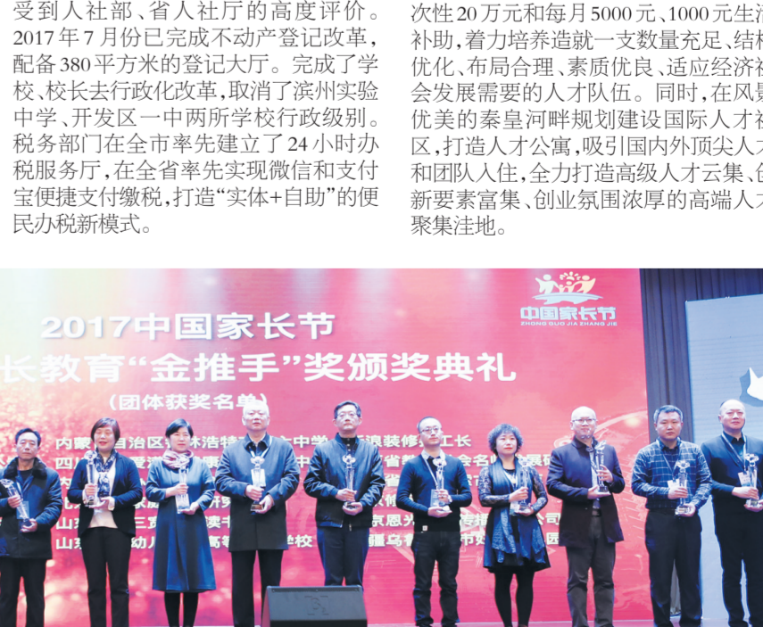
11月25日-26日,成功举办了2017中国家长节,“家校社共育”的滨州模式已在全国15省市、60多个县市的近300所学校推广落实。