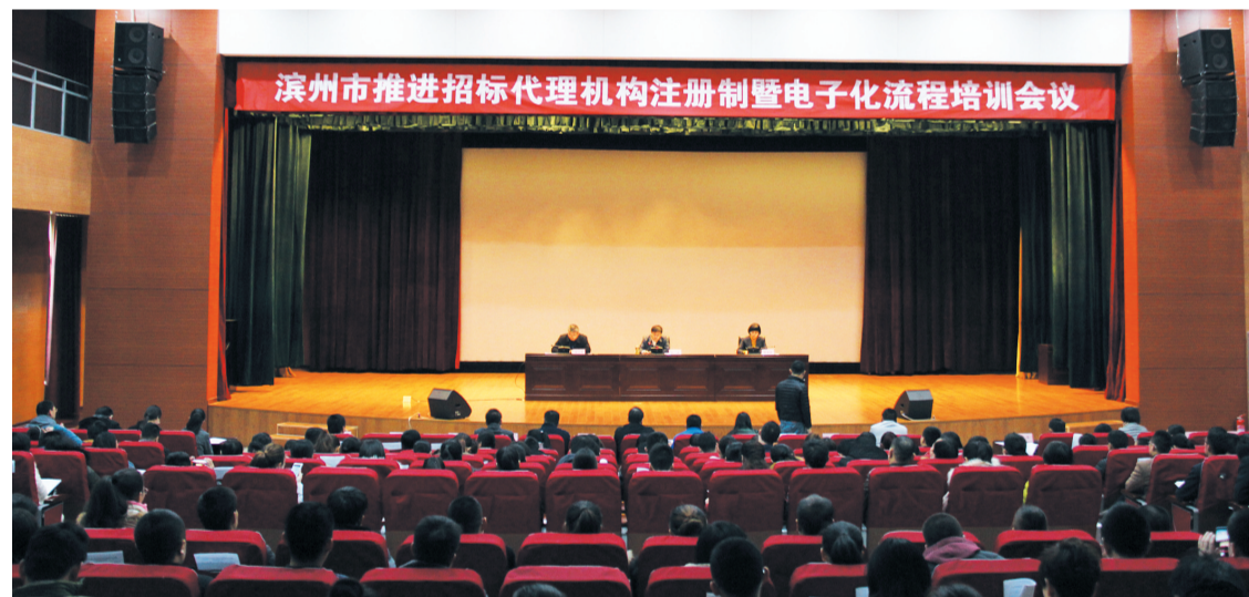
2017年11月29日,市公共资源交易中心组织召开了首期推进招标代理机构注册制暨电子化流程培训,各招标代理机构工作人员及各县区公共资源交易中心负责人共280余人参加培训。

我市作为全省首个数据对接试点市,在实现公共资源交易工作市县(区)“一体化”的基础上,按照省级公共资源交易电子服务平台与地市级公共资源交易服务平台对接测试工作要求,完成了与山东省公共资源交易服务平台的数据对接工作。同年,完成了与中国招标投标公共服务平台的数据共享对接,率先实现了国家、省、市、县四级平台信息数据的互联互通与共享。