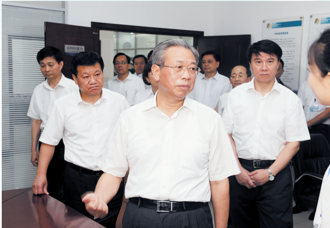
2017年7月8日,省委书记刘家义同志视察市公共资源交易中心,对交易中心在全流程电子化、市县“一体化”方面的工作给予充分肯定。