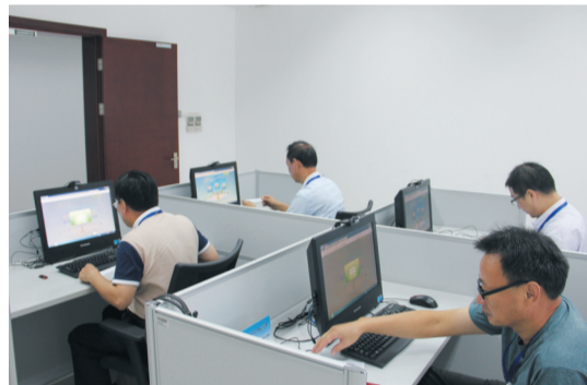
2017年8月31日至9月1日,我市政府采购、建设工程跨省远程异地评标项目在江苏省南通市公共资源交易中心双双首评成功,标志着我市公共资源交易跨区域远程异地电子评标工作再上新台阶。