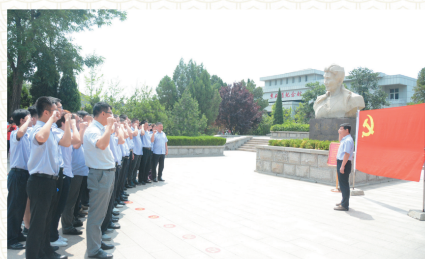
分行全体党员参观魏福祥纪念馆对党旗宣誓。