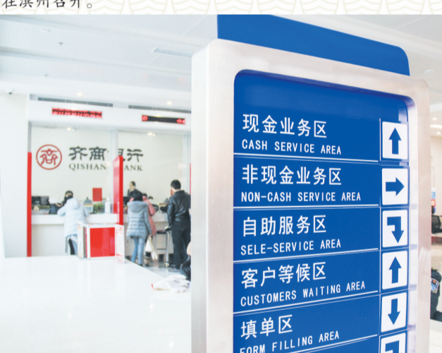
为市民提供优质金融服务。