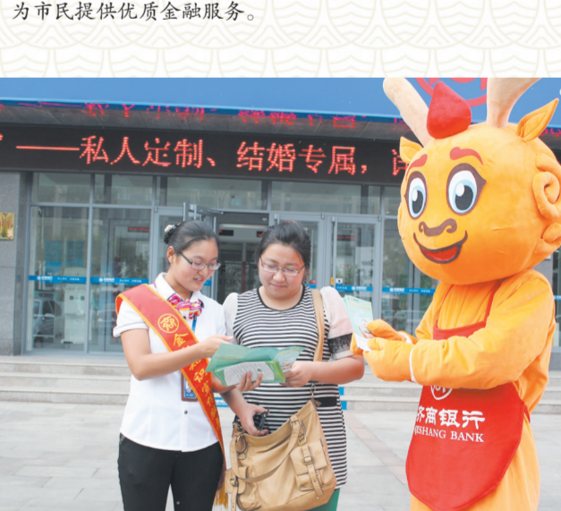
积极参与“金融知识进万家”活动。