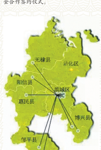
业务范围已覆盖滨州各个区县。