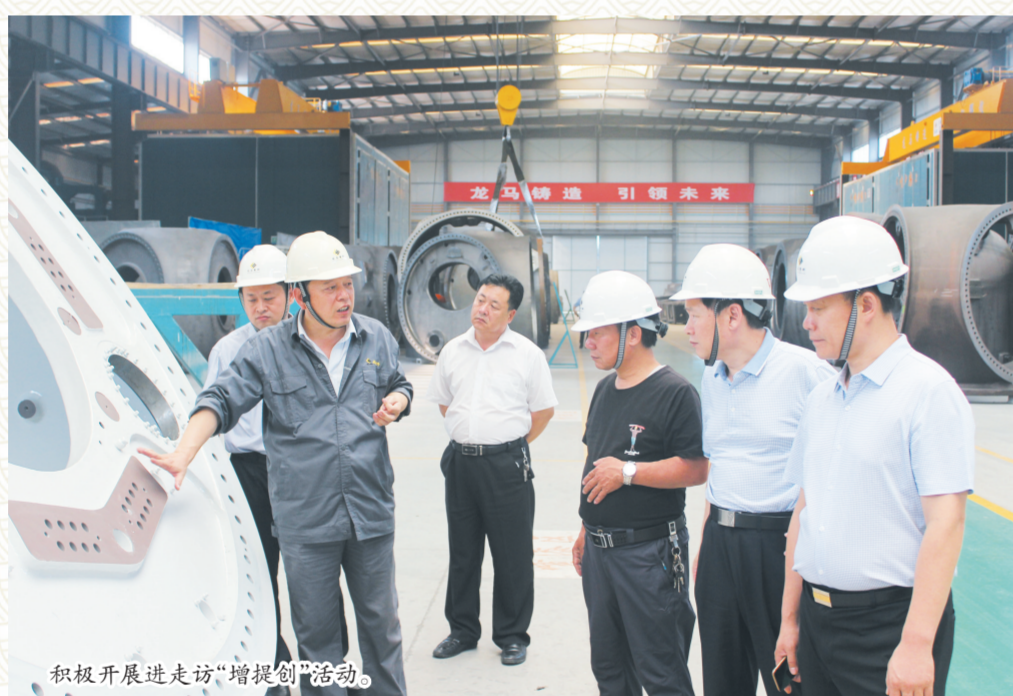
积极开展走访“增提创”活动。

服务实体经济更关键的一步,是实现为小微企业提供融资服务向提供综合金融服务的职能转变。自成立以来,滨州分行不断进行组织架构变革,业务模式创新,综合经营探索,将创新按照经营特色和服务功能三个维度进行划分,通过差异化定位,找准发展方向,实现特色化发展,做深做透区域市场,形成在该区域市场上的竞争优势。