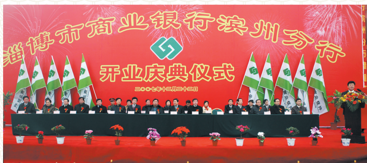
2007年12月22日,淄博市商业银行滨州分行隆重开业。