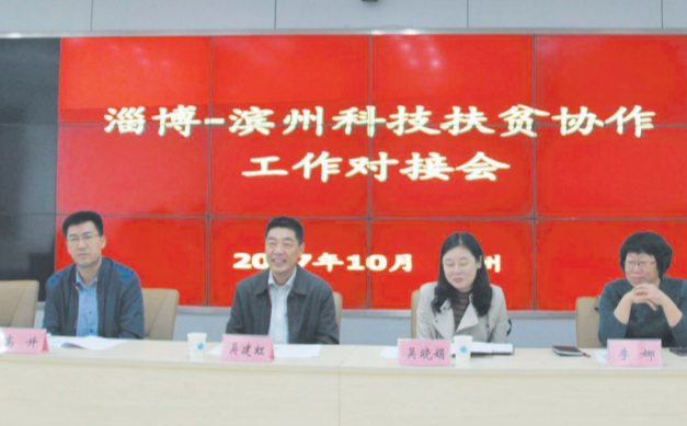
2017年10月25日,淄博-滨州科技扶贫协作工作对接会在滨州召开。

金融是现代经济的核心,金融服务实体经济是解决我国经济发展“不平衡不充分”问题的关键因素。党的十九大报告提出:“深化金融体制改革,增强金融服务实体经济能力”。一帆风顺,显示不出水手的坚强;百转千回,才有百炼成钢。下一个十年,齐商银行滨州分行将围绕滨州市委市政府中心工作,坚持以质量和效益为中心,加快经营转型和结构调整,全面深化改革创新,保持稳健经营,以更加宽广的视野和胸怀,以更加昂扬有为的姿态,努力在推动经济社会与自身发展中,彰显更大的责任与担当!