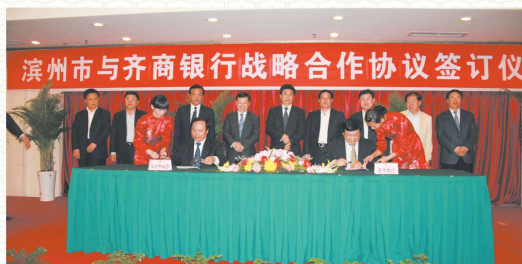
2009年,滨州市与齐商银行签订战略合作协议。