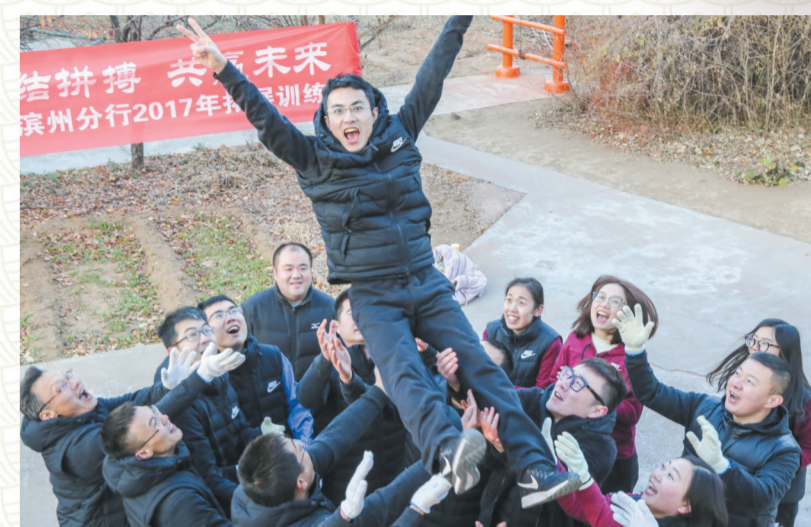
组织拓展训练提升员工素质。

十年,时间似乎并不长。21世纪的第一个十年,是全球经济格局发生裂变的十年,更是全球知识生产和消费方式产生革命性变化的十年。这十年,是滨州经济和社会发展的“超速”年代:生产超速增长,规模超速扩张,结构超速演进,财富超速积累,开放超速前进。一旦打开,风从世界来。2007年12月22日,山东省城市跨地市设立的第一家省内分行齐商银行滨州分行正式成立。从滨州出发,重新思考未来,这是首家入驻滨州的异地金融机构,也是齐商银行跨地区经营所迈出的第一步。成立以来,滨州分行立足于滨州,以永不懈怠的精神状态和一往无前的奋斗姿态,坚持“市民银行”和“中小企业主办行”的市场定位,走“精细化、特色化、多元化”之路,坚定不移地将服务中小、支持当地实体经济作为己任,成为支持滨州经济社会发展的重要金融力量。