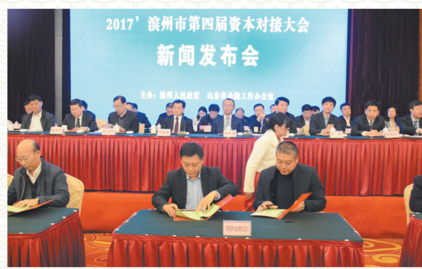
2017年滨州市第四届资本对接大会,分行与新旧动能转换企业签订合作意向书。