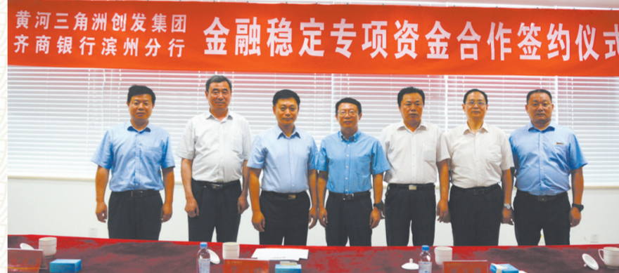
2017年6月28日,齐商银行滨州分行与黄河三角洲创业集团举行金融稳定专项资金合作签约仪式。

同时该行还不断加强文明规范服务管理,结合滨州市创建文明城市,充分发挥省级文明单位带头作用,打造金融窗口,网点服务水平得到不断提升。该行积极参加滨州市消费者权益保护日、打击非法集资宣传月、金融知识普及月、金融知识进万家、防范打击电信诈骗等宣传活动,进一步普及金融知识,提升金融服务水平,在宣传业务的同时为广大家庭筑起了一道坚固的金融堡垒。