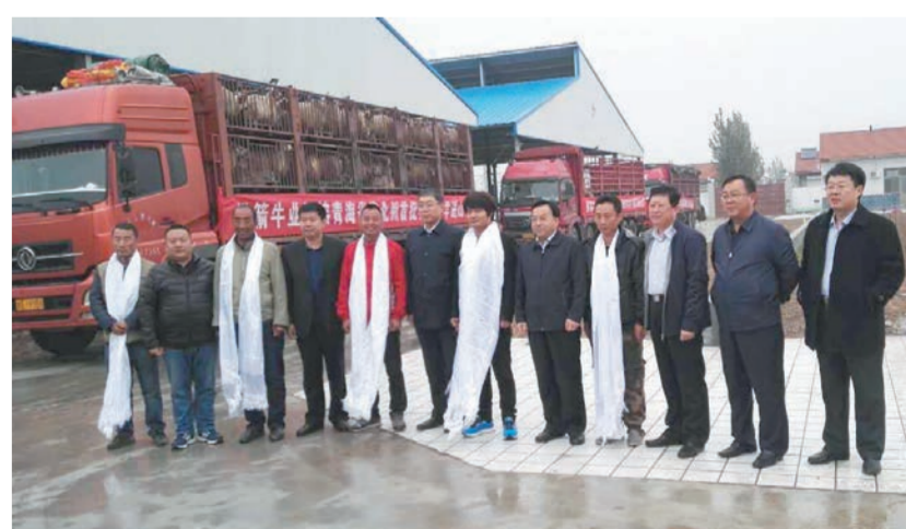
创新援青模式,开展“千牛万羊”进山东