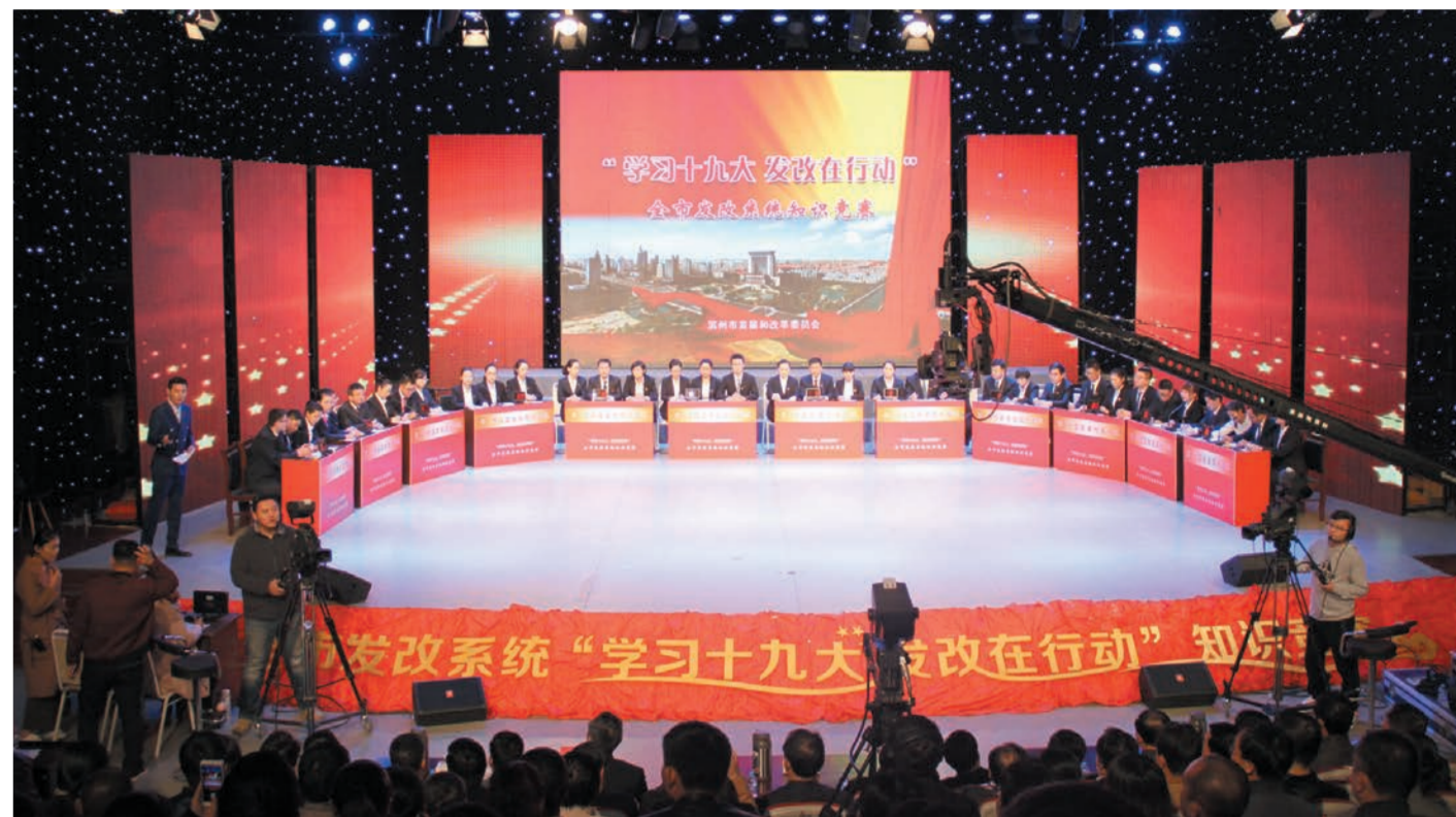
发改系统“学习十九大 发改在行动”知识竞赛