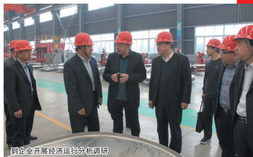
到企业开展经济运行分析调研