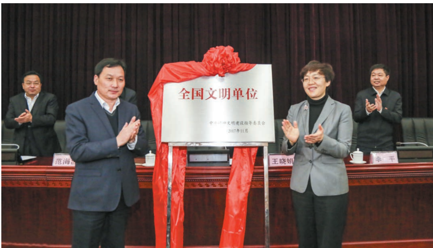
滨州市发展和改革委员会荣获“全国文明城市”称号