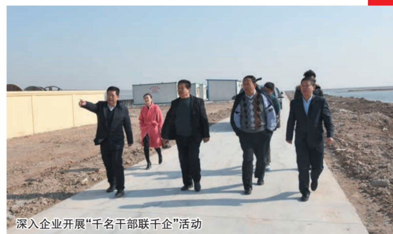
深入企业开展“千名干部联千企”活动

注重家风家教。开展“重家教、传家训、树家风”、“庆三八”家风家教我行动等活动,推动社会主义核心价值观内化于心、外化于行。