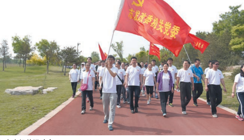
组织参加市直机关运动会