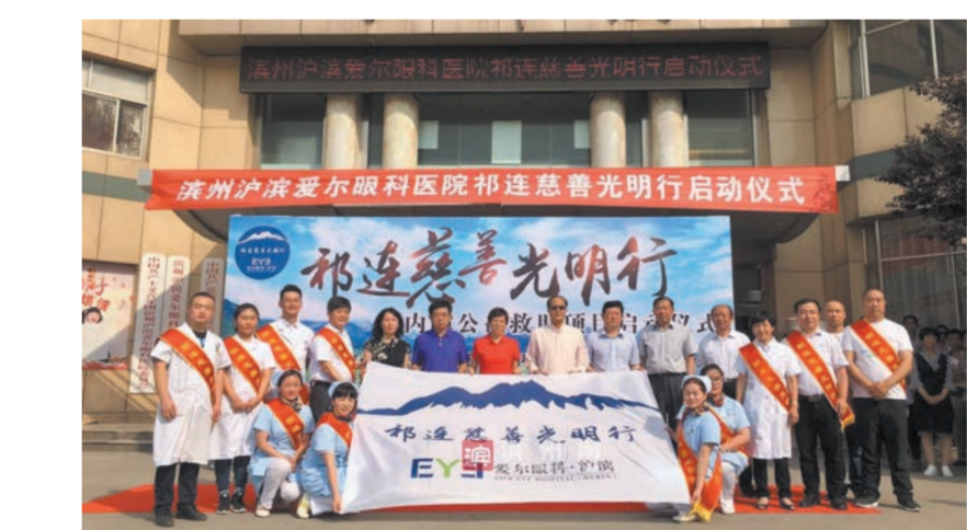
对接祁连慈善光明行动

创建推向深入,推动发改各项工作不断迈上新台阶,为建设更高质量更高水平的小康滨州作出新的更大贡献。