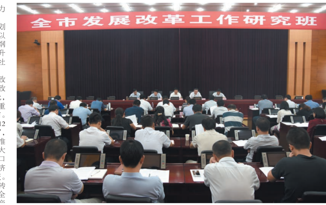
全市发展改革工作研究班

注重文体生活。为留住历史、凝聚文化,筹划举办了“发展改革六十年回顾展”,大大振奋了发改干事创业的精气神。开展了演讲比赛、拓展培训、党员健步走等不同形式文体活动,持续激发创建活力。