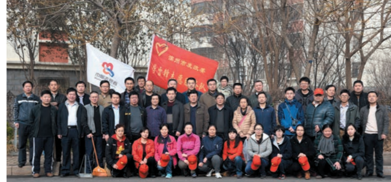
开展学雷锋志愿服务活动