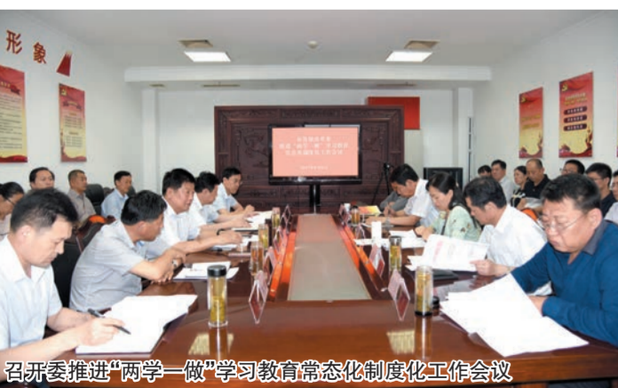
召开推进“两学一做”学习教育常态化制度化工作会议

落实主体责任。在市直部门率先制定了《关于落实党风廉政建设主体责任的实施意见》,明确“四张”清单和六项制度,严格落实全面从严治党主体责任。充分运用监督执纪“四种形态”,集中开展廉政谈话活动,抓早抓小,防微杜渐,让“咬耳扯袖、红脸出汗”成为常态,这一做法被省发改委作为典型经验推广。