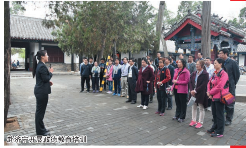
赴济宁开展政德教育培训