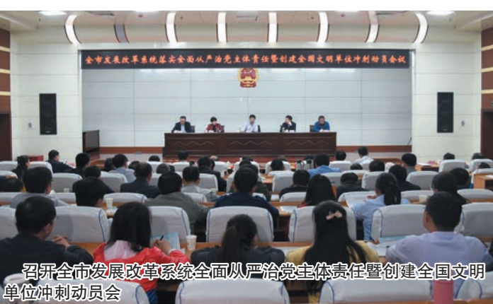
召开全市发展改革系统全面从严治党主体责任暨创建全国文明城市冲刺动员会