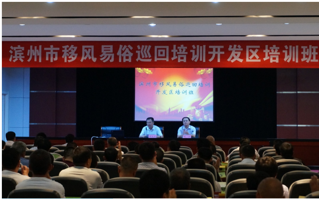
开发区移风易俗工作培训班。

同时,加强全区188个村居的红白理事会建设,制定章程,并写入村规民约,提出了“四有标准”:一是要有人管事。红白理事会由群众推举德高望重、热心服务、公平公正、崇尚节俭、有一定礼仪特长的人士组成。二是要有章程理事。红白理事会在符合当地风土人情、尊重社情民意、遵守婚姻和殡葬等相关法律法规的基础上,制定理事会活动章程,确定办事程序、服务规