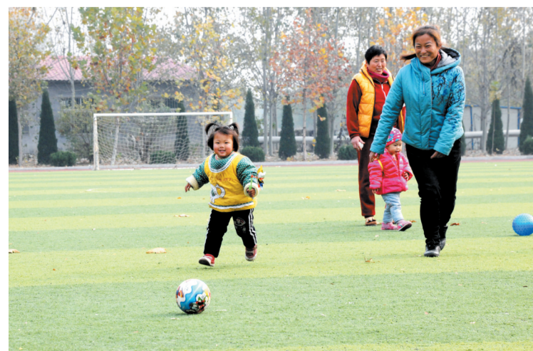
在韩店镇健身广场,居民乐享休闲时光。