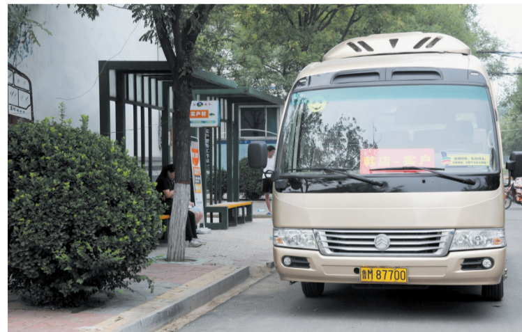
全镇域免费公交已运行7年。