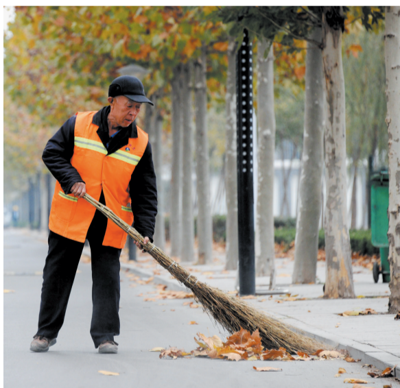
市场化运营使城乡环卫一体化运作更具生机。