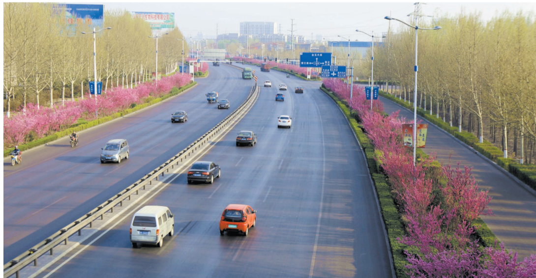
宽阔整洁的邹韩路,春天到来时紫荆盛开。