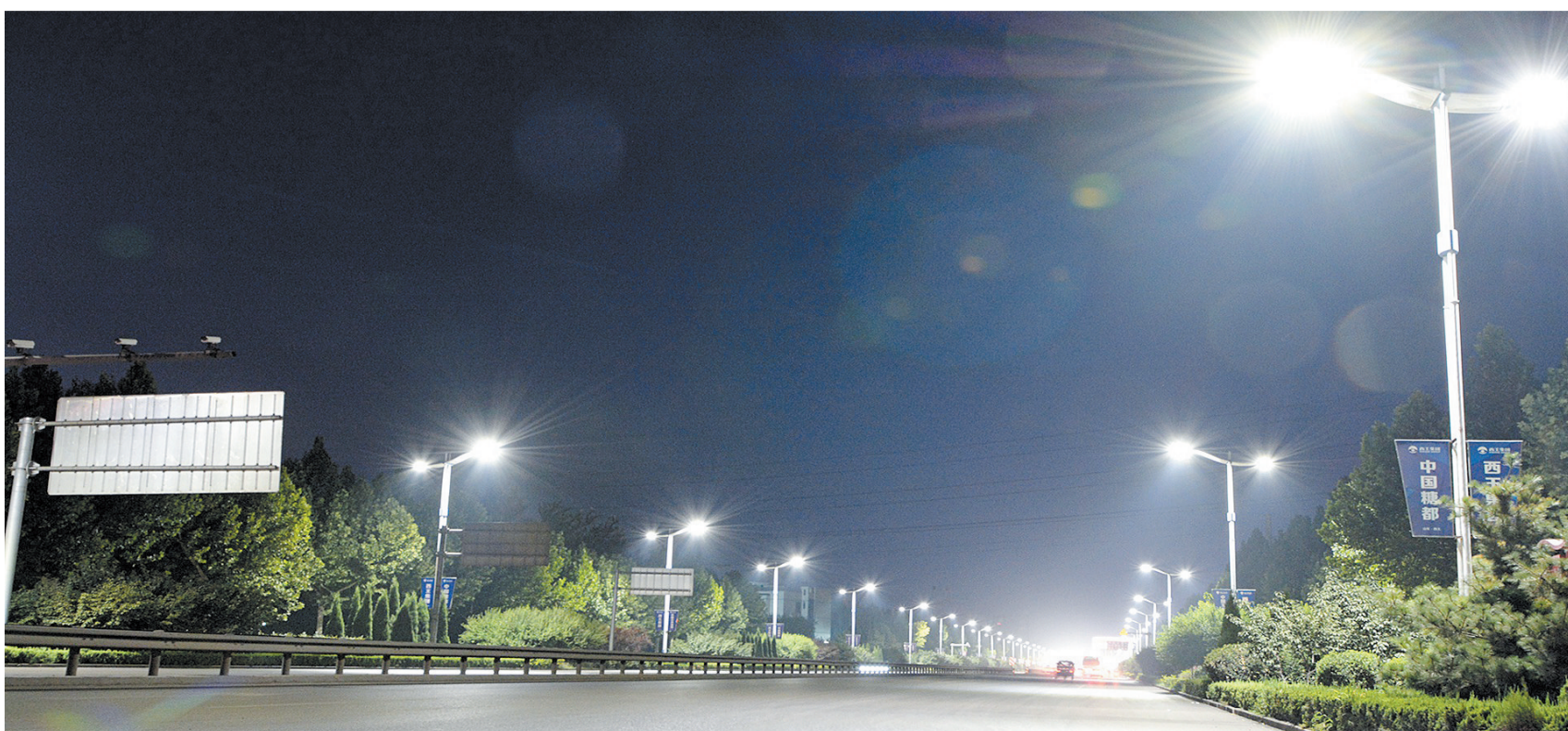
总投资1270万元的LED路灯改造工程照亮居民“夜生活”。