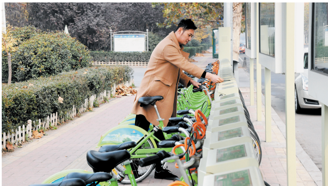
韩店镇公共自行车交通系统现有24个网点,居民出行更加便捷。