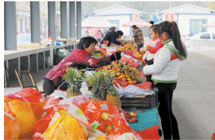
洁净亮堂的市场改善了居民的购物环境。