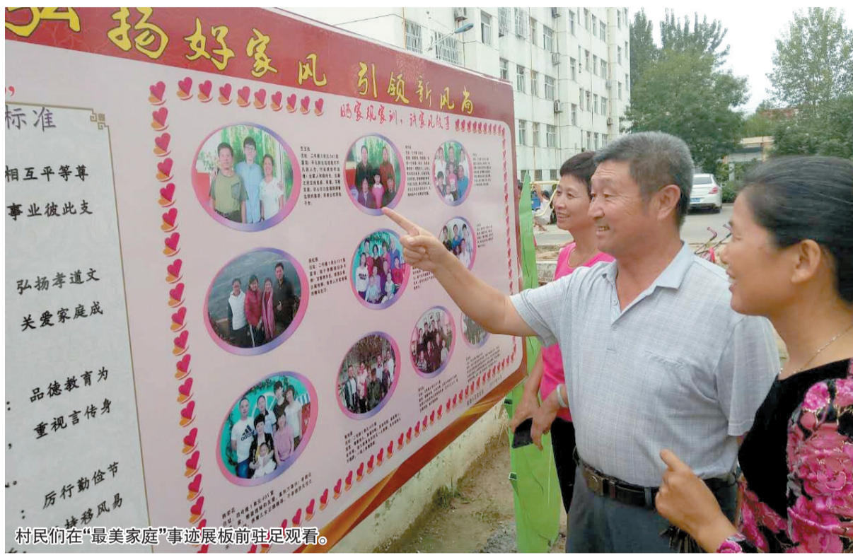
村民们在“最美家庭”事迹展板前驻足观看。

科学规划公益性墓地建设。为进一步完善公益性、惠民殡葬服务体系，滨城区制定扶贫殡葬政策，扶贫范围包含区级所有贫困村（居），全面解决殡葬空白。各乡镇（街道）至少规划建设一处公益性公墓，20%的乡镇