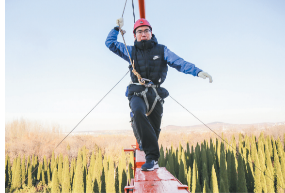
勇于战胜困难，展现自己最好的一面。