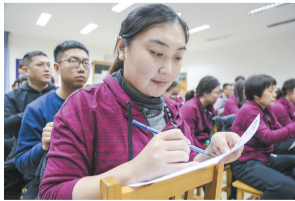
认真聆听，积极参与比赛。