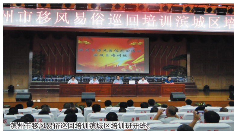
滨州市移风易俗巡回培训滨城区培训班开班。