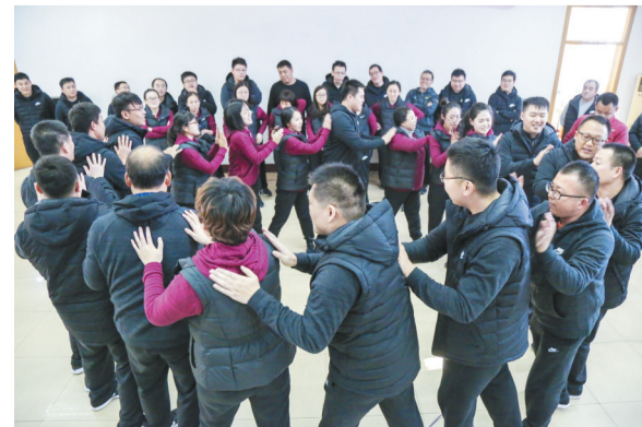
团队游戏让大家凝心聚力。