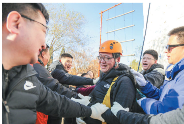
高空训练前，学员们互相加油打气。