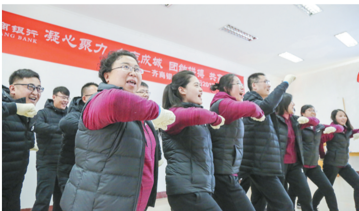
凝心聚力，众志成城。

该行相关负责人表示，此次拓展活动是对每位干部员工的一次灵魂的洗涤，让大家懂得了承担的价值、团队的力量。同时，希望大家把本次活动中的所学所想进一步吸收消化，带到实际工作、生活中去，助推分行各项业务再上新台阶。