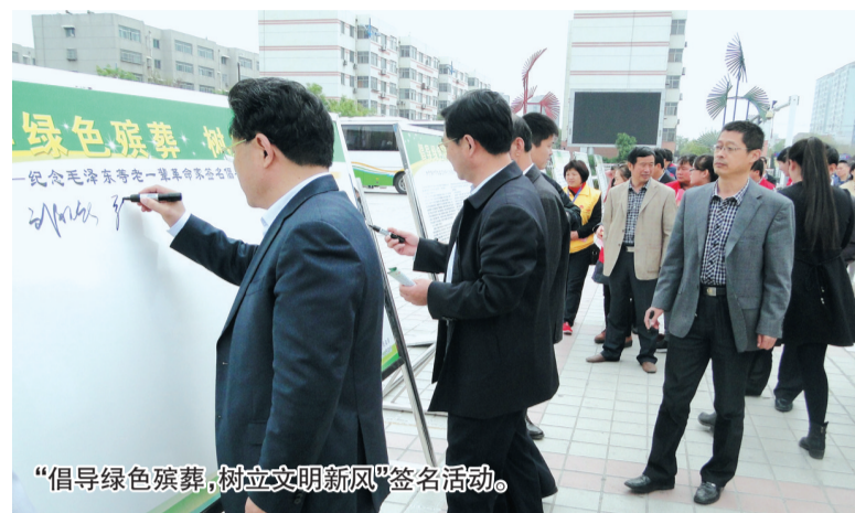
“倡导绿色殡葬，树立文明新风”签名活动。

为提高村民文明争优意识，滨城区扎实开展善行义举四德榜建设、社区文明素质教育活动和各类评比竞赛活动，分别在遵纪守法、环境卫生、家庭和睦、孝敬老人、社会公德、移风易俗等方面进行量化，评选“最美家庭”“卫生家庭”“好媳妇好婆婆”，并在善行义举四德榜进行公开表彰，以健康向上、情趣高尚的文化引领群众，坚决杜绝各种封建迷信活动，自觉抵制陋习，将移风易俗活动常态化，营造人人崇尚文明，人人创建文明，人人享受文明的良好氛围，形成“以简朴为荣、以节约为美”的社会新风尚。