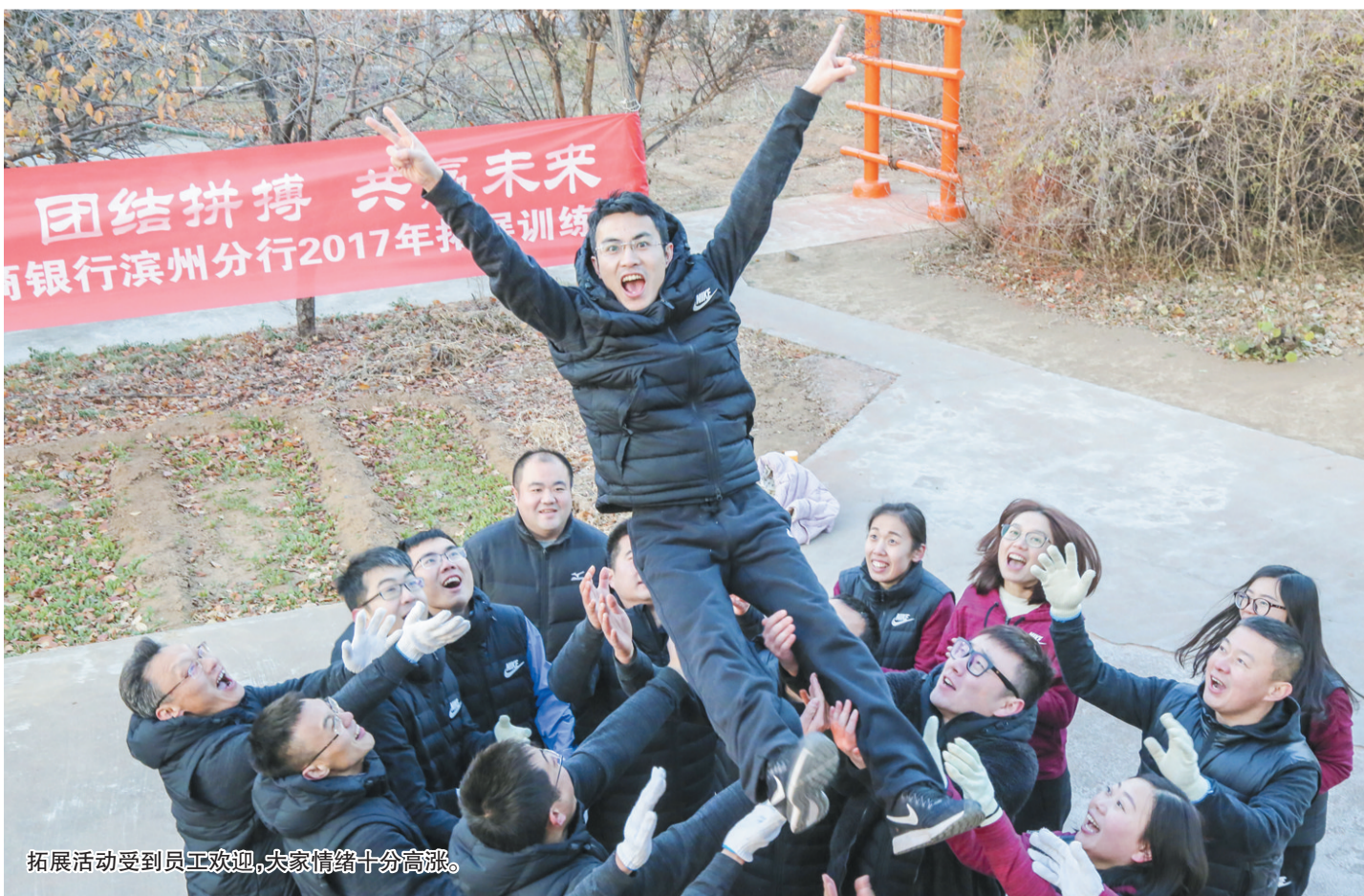
拓展活动受到员工欢迎，大家情绪十分高涨。