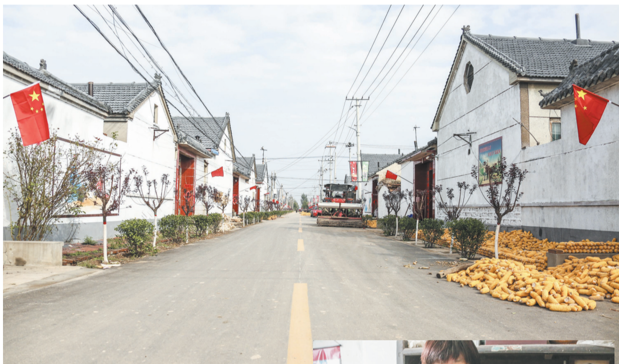
除了发展古旧家具产业,祁王村还致力于改善村容村貌,提升村民生活质量。

同步进行的,还有扶持壮大村集体经济的工作。目前,祁王村正在与东营市泰富集团洽谈1个设施农业项目,占地20亩,预计投资100万元。下一步,祁王村还将主动对接特色小镇创建工作,承载民俗文化旅游区休闲娱乐功能转移,努力把“农村变景区、产品变礼品、农房变客房”,真正建设成富裕、和谐、幸福的美丽乡村。