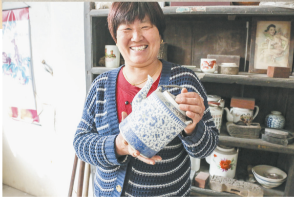
一位村民展示她家的收藏品。