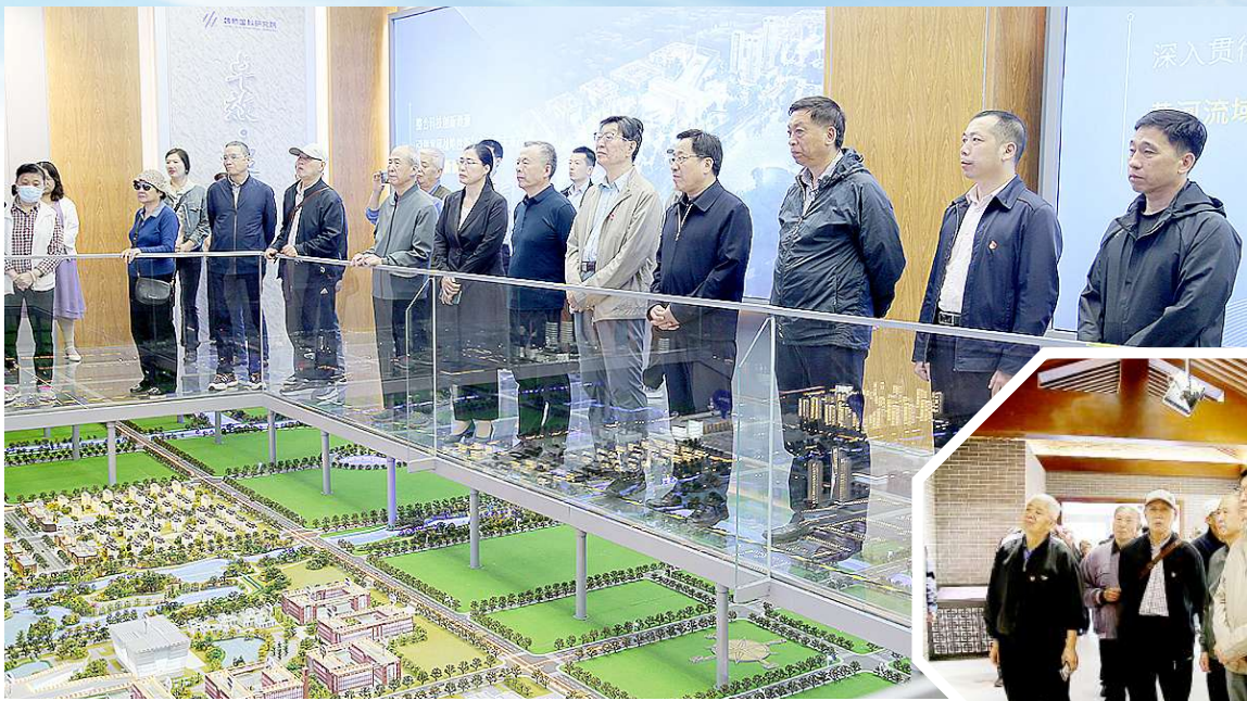
参观魏桥国科(滨州)科技园。