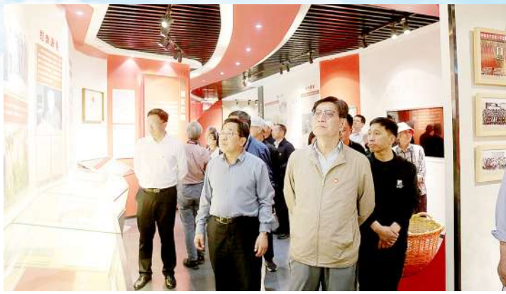
省直机关工委离退休老干部参观杨柳雪不忘初心党性教育基地。