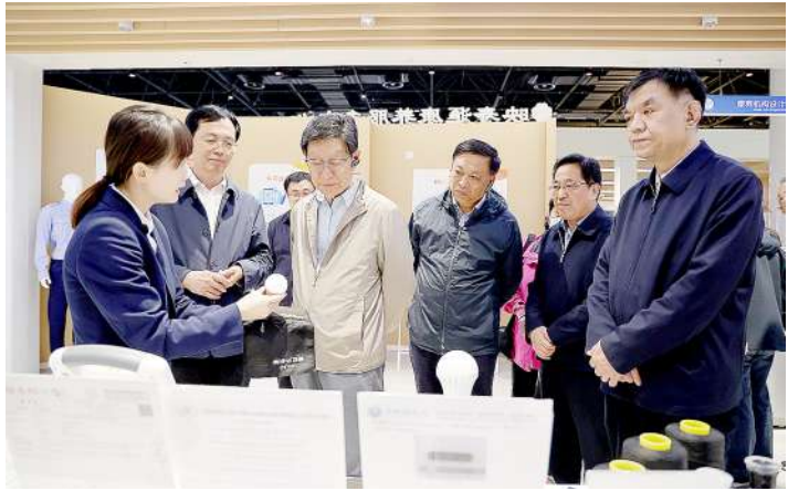
参观欣悦健康生命科技馆。